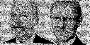
Stjórnarformaður og framkvæmdastjóri Lífeyrissjóðs bænda

sjóðnum. Það hefur hins vegar ekkert með lífeyrisréttindi að gera.