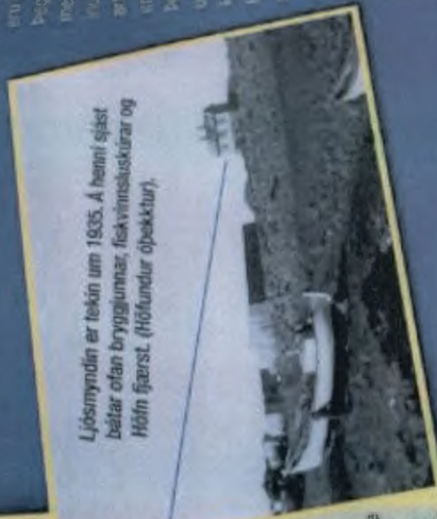
Ljósmyndin er tekin um 1935. Á henni sjást bátar ofan bryggjumnar, fiskvinnsluskúrar og Höfn fjærst.

útan af því í arþúsundin. Vestasta hluti Hvalsnes néðst Höfnnes.