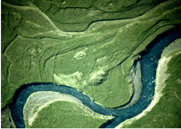
Loftmynd af Þingey.

Segja má að sýnilegar tóftir í Þingey skiptist í tvo flokka. Annars vegar eru misstórar tóftir, misjafnar að lögun og gerð, sem liggja óreglulega hér og þar, og hins vegar eru aflangar tóftir sem liggja í beinum röðum, með lengdarstefnu N-S, og skiptast niður í regluleg, vel afmörkuð hólfi. Tóftir í síðarnefnda flokknum hafa fyrri athugendur talið vera leifar þingbúða og er freistandi að taka undir þá skoðun.