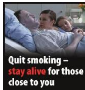
Hættu að reykja – lifðu lengur fyrir þína nánustu