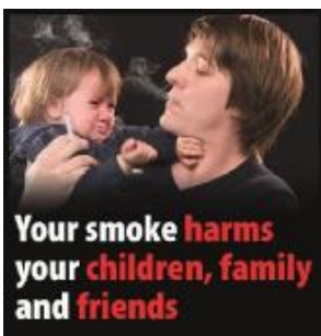
Tóbaksreykur skaðar börn þín, fjölskyldu og vini