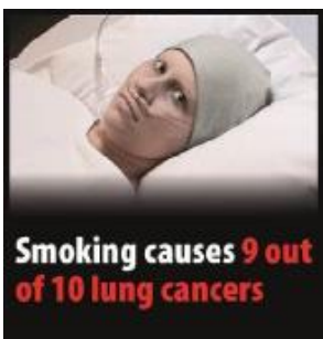
Reykingar eru orsök lungnakrabbameins í nfu af hverjum tíu tilvikum