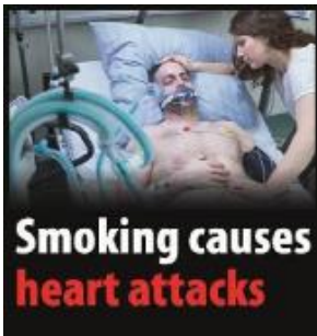
Reykingar valda hjartaáföllum