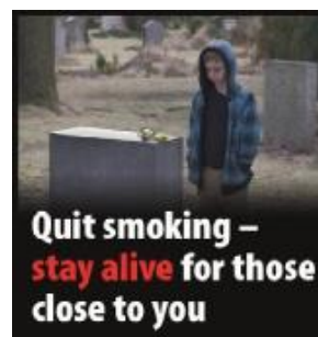
Hættu að reykja – lifðu lengur fyrir þína nánustu