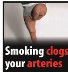
Reykingar stífla slagæðar