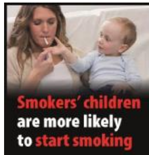
Börn foreldra sem reykja eru líklegri til að byrja að reykja en börn annarra