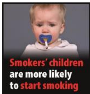
Börn foreldra sem reykja eru líklegri til að byrja að reykja en börn annarra