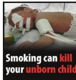
Reykingar geta valdið andláti barns í móðurkviði