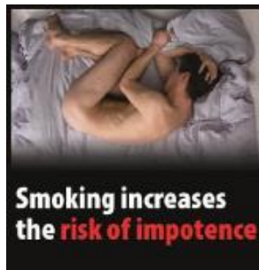
Reykingar auka hættu á getuleysi