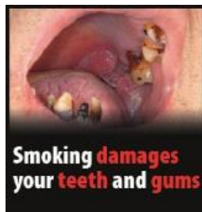
Reykingar skaða tennur og tannhold