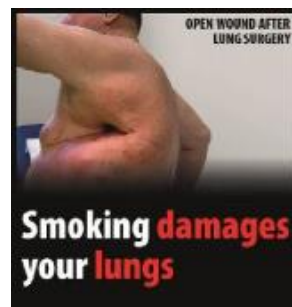
Reykingar skaða lungun í þér