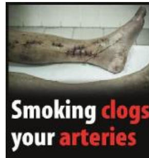
Reykingar stífla slagæðar