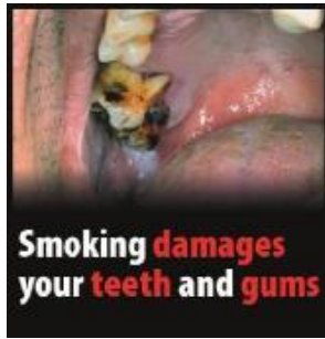
Reykingar skaða tennur og tannhold