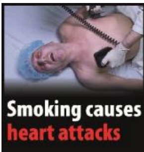
Reykingar valda hjartaáföllum