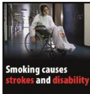
Reykingar valda heilablóðföllum og fötlun