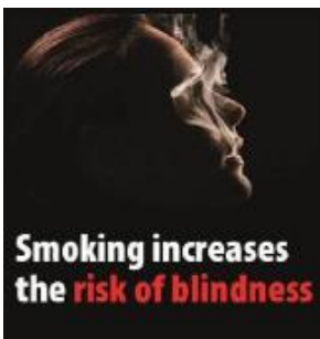
Reykingar auka hættu á blindu