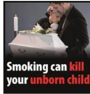
Reykingar geta valdið andláti barns í móðurkviði