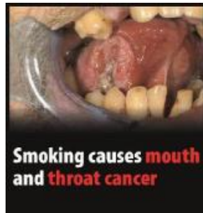
Reykingar valda krabbameini í munnholi og hálsi