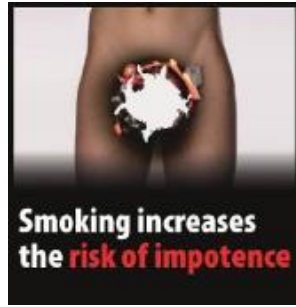
Reykingar auka hættu á getuleysi