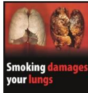
Reykingar skaða lungun í þér