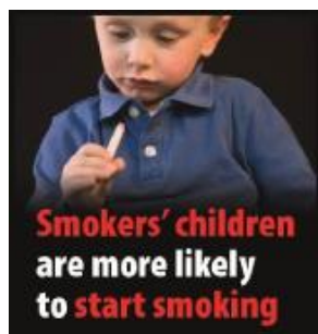
Börn foreldra sem reykja eru líklegri til að byrja að reykja en börn annarra