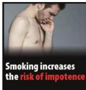
Reykingar auka hættu á getuleysi