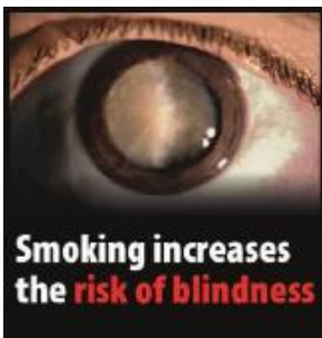
Reykingar auka hættu á blindu