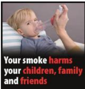
Tóbaksreykur skaðar börn þín, fjölskyldu og vini