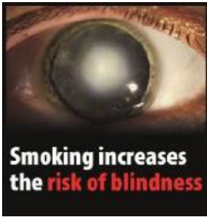
Reykingar auka hættu á blindu