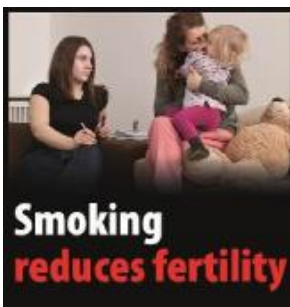
Reykingar draga úr frjósemi