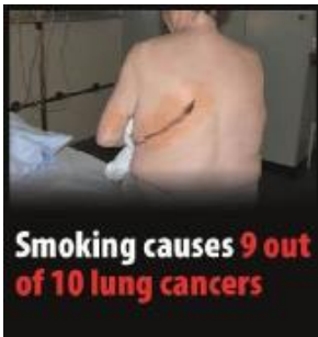
Reykingar eru orsök lungnakrabbameins í nínu af hverjum tíu tilvikum