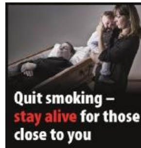
Hættu að reykja – lifðu lengur fyrir þína nánustu