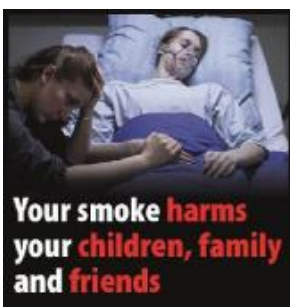
Tóbaksreykur skaðar börn þín, fjölskyldu og vini