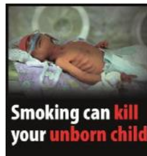
Reykingar geta skaðað barn í móðurkviði