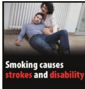
Reykingar valda heilablóðföllum og fötlun