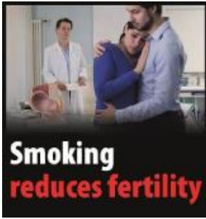
Reykingar draga úr frjósemi