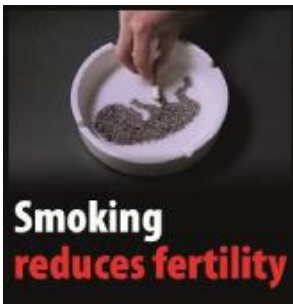
Reykingar draga úr frjósemi