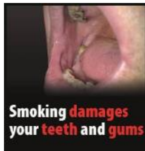
Reykingar skaða tennur og tannhold