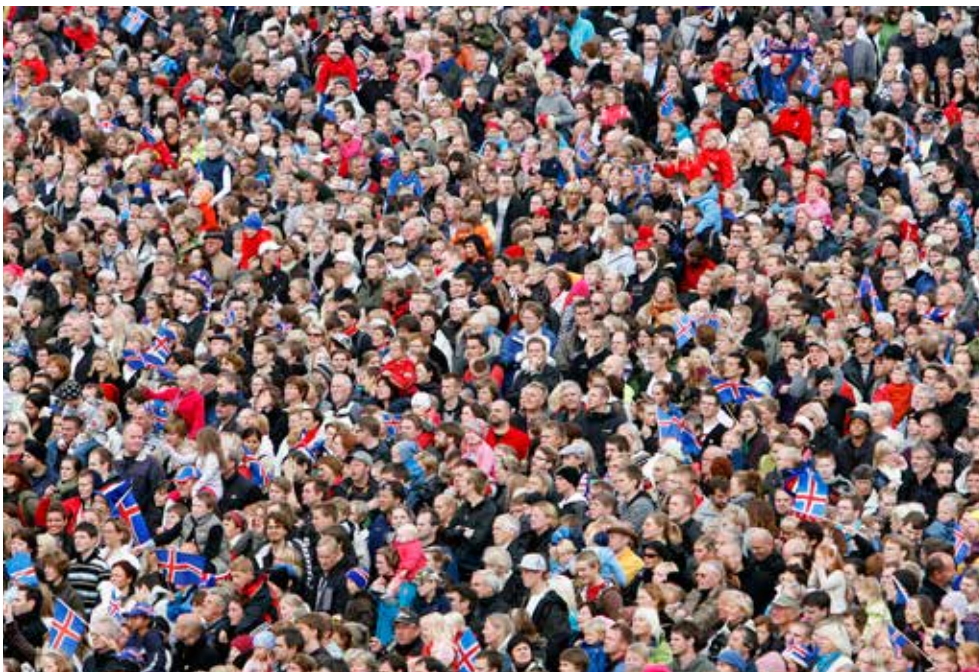
Í alþingiskosningunum í apríl 2013 neyttu 81,5% kosningaberra manna kosningarréttar síns.

Ef kjósendur á kjörskrá að baki hverju þingsæti, að meðtöldum jöfnunarsætum, eru eftir alþingiskosningar helmingi færri í einu kjördæmi en öðru skal landskjörstjórn breyta fjölda þingsæta í kjördæmum í því skyni að draga úr þeim mun. Þessu ákvæði var beitt strax að loknum kosningum til Alþingis 2003 og tilkynnti landskjörstjórn að eitt kjördæmissæti flyttist úr Norðvesturkjördæmi yfir til Suðvesturkjördæmis í næstu kosningum. Aftur var gerð breyting á fjölda kjördæmissæta eftir alþingiskosningarnar 2009 og eru þau nú 11 í Suðvesturkjördæmi, sjö í Norðvesturkjördæmi en níu í öðrum kjördæmum. Breytingar á kjördæmamörkum og tilhögun á úthlutun þingsæta, sem fyrir er mælt í lögum, verða aðeins gerðar með samþykki 2/3 atkvæða á Alþingi. Kosið var eftir þessari kjördæmaskipan í fyrsta sinn í alþingiskosningunum 2003 en landinu var áður skipt í átta kjördæmi og hafði sú skipan verið á síðan 1959.