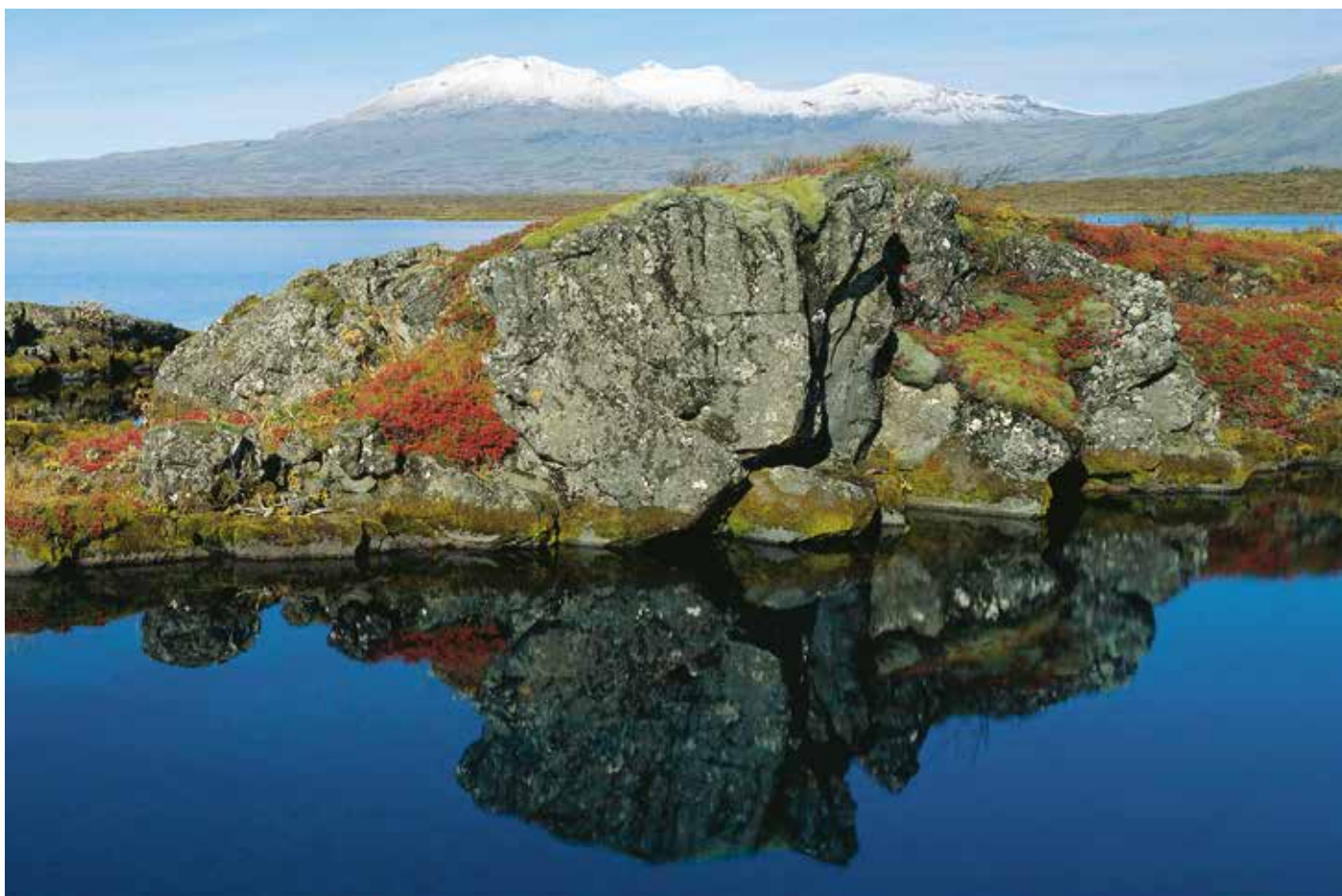
Á fáum stöðum á Íslandi fléttast saga og náttúra jafnmikið saman og á Þingvöllum. Þar gefst einstök yfirsýn yfir jarðfræðisögu, og lifandi náttúra Þingvallasveitar á sér vart hliðstæðu. Á Þingvöllum var allsherjarriki á Íslandi komið á fót með stofnun Alþingis 930 og þar kom þingið saman allt til ársins 1798.

Ákvæði stjórnarskrár um skoðanafrelsi, tjáningarfrelsi, félagafrelsi og fundafrelsi eru einnig skýr einkenni lýðræðisskipulagsins. Í reynd eru þessir þættir nauðsynleg forsenda lýðræðis svo að þegnum landsins sé tryggður réttur til þátttöku í málefnum þjóðfélagsins. Ákvarðanir sem teknar eru á Alþingi hafa áhrif á daglegt líf allra Íslendinga. Markmiðið með útgáfu kynningarbæklings um Alþingi er að greina frá skipulagi og störfum þingsins ásamt sögu þess. Hann ætti því að nýtast öllum þeim sem hafa áhuga á að fræðast um Alþingi.