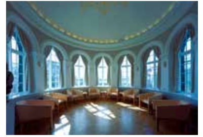
Kringlan var byggð við Alþingishúsið 1908.

Alþingishúsið hósti í fyrstu ekki einungis starfsemi þingsins heldur einnig þrjú söfn landsins, Landsbókasafnið, Forngripasafnið og Listasafn Íslands. Viðbyggingin Kringlan var reist 1908. Hún var upphaflega risnuherbergi ráðherra, síðar kaffistofa, en þar er nú setustofa. Þegar Háskóli Íslands tók til starfa haustið 1911 fékk hann húsnæði á 1. hæð Alþingishússins, en tvö safnanna höfðu þá verið flutt úr húsinu. Háskólinn fluttist síðan í eigið húsnæði 1940. Skrifstofur ríkisstjóra og síðar forseta Íslands voru í húsinu 1941–1973. Alþingishúsið er fyrir löngu hætt að rúma alla starfsemi þingsins. Það á nú eða leigir nokkur hús í næsta nágrenni þinghússins. Á 1. hæð þinghússins er skrifstofa forseta Alþingis, flokksherbergi stjórnmalaflokka og fundarherbergi. Á 2. hæð er þingsalurinn, setustofa þingmanna, skrifstofa skrifstofustjóra Alþingis og þingfundaskrifstofa. Á 3. hæð eru þingpallar og vinnuherbergi blaðamanna. Í Skálanum er aðalinnangangur í Alþingishúsið og ýmis þjónusta fyrir þingmenn, starfsmenn og gesti, m.a. fundarherbergi, matsalur og eldhús. Skálinn var teiknaður á arkitektastofunni Batteríinu.