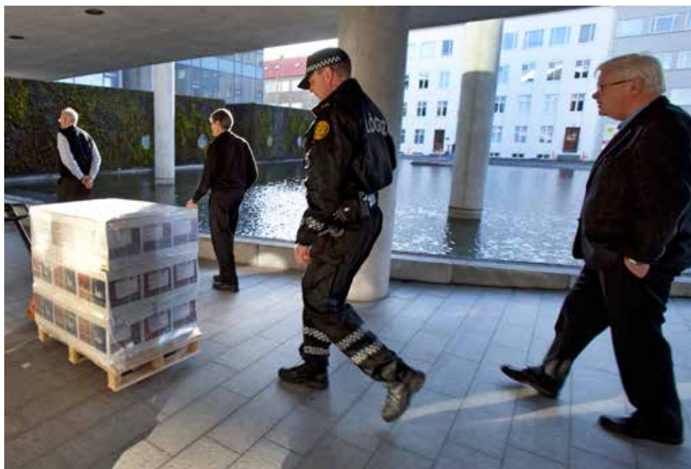
Lögreglan sér um að flytja kjörseðla úr prentsmiðju á kjörstaði.

Í alþingiskosningum leita stjórnmalaflokkarnir umboðs þjóðarinnar til að taka ábyrgð bæði á löggjafarvaldi og framkvæmdarvaldi. Rík hefð er fyrir myndun meirihlutastjórna en stjórnarandstaðan á þingi veitir stjórninni aðhald. Alþingiskosningar fara að jafnaði fram fjórða hvert ár. Forseti Íslands getur þó rofið þing áður en venjulegu kjörtímabili lýkur og efnt til nýrra kosninga. Kosningarrétt við alþingiskosningar eiga allir íslenskir ríkisborgarar sem eru 18 ára eða eldri þegar kosning fer fram og eiga eða hafa átt lögheimili hér á landi. Kjörgengur við kosningar til Alþingis er hver sá sem á kosningarrétt og hefur óflekkað mannorð. Framboð til Alþingis er háð ýmsum skilyrðum, svo sem að nægilegur fjöldi manna hafi gefið skriflega yfirlýsingu um stuðning við framboðslistann. Að kosningum loknum taka 63 kjörnir þingmenn sæti á Alþingi.