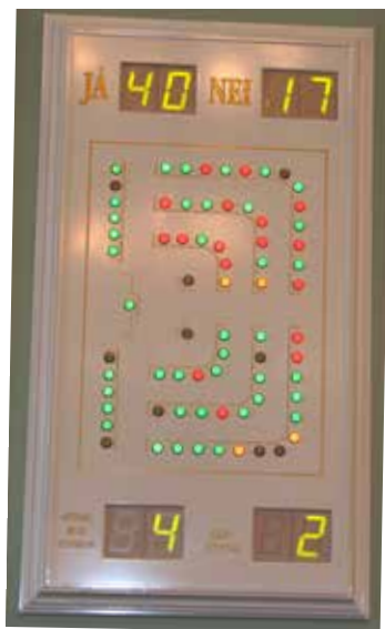
Þingmenn greiða atkvæði með því að ýta á einn af þremur hnöppum sem eru í borðum þeirra. Niðurstöðurnar, og hvernig hver og einn greiðir atkvæði, birtast á ljósatöflum í þingsalnum.

Þegar vandi stæðar að í íslensku þjóðfélagi er oft sagt að nú verði Alþingi að grípa í taumana. Þetta sést á bloggsíðum, í lesendabréfum og greinum dagblaðanna, heyrst í útvarps- og sjónvarpsviðtölum og yfir kaffibolla heima í eldhúskrók. Þegar til kastanna kemur eru það stjórnmalamenn sem ákveða hvort rétt sé að taka á viðfangsefninu með lagasetningu. Hugmyndir um lagasetningu geta komið víða að. Hagsmunaaðilar reyna að hafa áhrif á undirbúning lagasetningar, oft í gegnum fjölmiðla. Einstaklingar geta einnig látið skoðun sína í ljós, t.d. með greinaskrifum og með því að hafa samband við