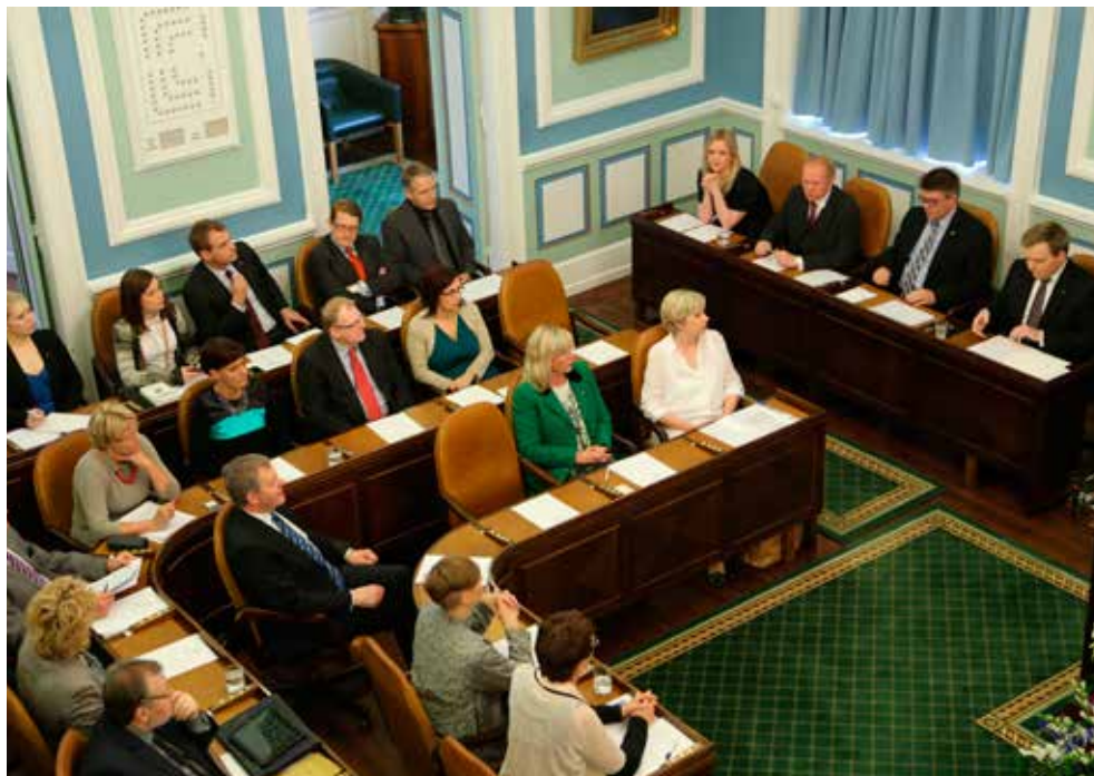
Eftir alþingiskosningar 2013 eiga sex stjórnmalasamtök fulltrúa á Alþingi: Björt framtíð, Framsóknarflokkur, Píratar, Samfylkingin, Sjálfstæðisflokkur og Vinstri hreyfingin – grænt framboð.