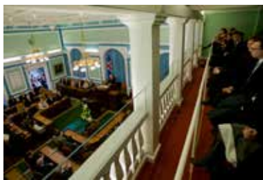
Þingpallar eru öllum opnir meðan þingfundir standa og þaðan er hægt að fylgjast með þingstörfum.

Í stjórnarskrá lýðveldisins Íslands er á því byggt að uppspretta valds sé hjá fólkinu sem felur kjörnum fulltrúum meðferð þess valds. Slíkt fyrirkomulag kallast fulltrúalýðræði. Kjósendur velja fjórða hvert ár í almennum leynilegum kosningum 63 þingmenn til setu á Alþingi. Þeir fara sameiginlega með vald til að setja þegnum landsins lög auk þess sem þeir fara með fjárstjórnarvald, þ.e. vald til að ákveða útgjöld ríkisins og þá skatta sem lagðir eru á landsmenn. Mikilvægt er að fólk viti hvaða ákvarðanir eru teknar á Alþingi og hvernig þær eru teknar því að kjósendur og fulltrúar þeirra bera ábyrgð á að varðveita virkt lýðræði. Segja má að kosningarrétturinn sé undirstaða lýðræðis á Íslandi og að Alþingi sé hornsteinn þess lýðræðis.