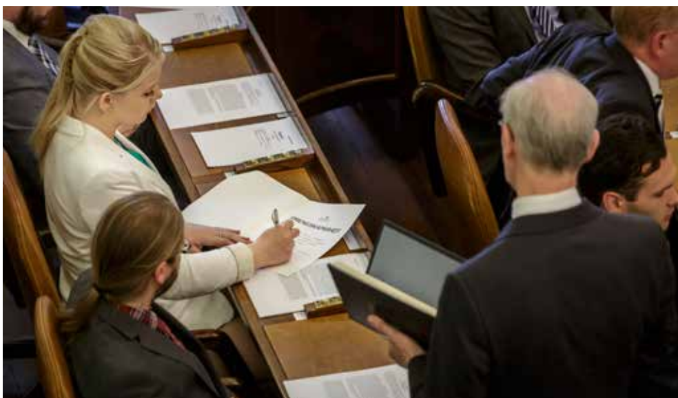
Þingmenn vinna drengskaparheit að stjórnarskránni þegar þeir taka sæti á Alþingi í fyrsta sinn.

Þú getur skrifað þingmönnum um mikilvæg málefni. Netföng eru á www.althingi.is . Heimilisfang: Alþingi, 150 Reykjavík. Þú getur hringt í þingmenn og komið sjónarmiðum þínum á framfæri. Sími: 563 0500.