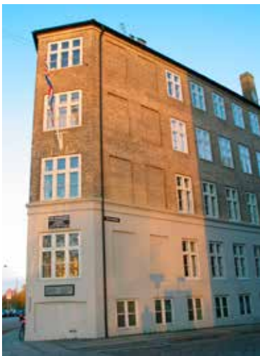
Jónshús við Øster-Voldgade 12 í Kaupmannahöfn.