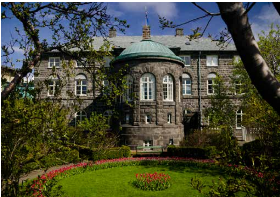
Alþingisgarðurinn og suðurhlíð þinghússins. Hafist var handa um framkvæmdir í garðinum árið 1893.