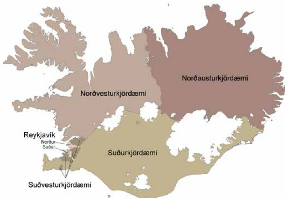
Ísland skiptist í sex kjördæmi, þrjú á höfuðborgarsvæðinu og þrjú landsbyggðakjördæmi. Fjöldi þingsæta í hverju kjördæmi tekur mið af íbúafjölda.

Í alþingiskosningum leita stjórnmalaflokkarnir umboðs þjóðarinnar til að taka ábyrgð bæði á löggjafarvaldi og framkvæmdarvaldi. Rík hefð er fyrir myndun meirihlutastjórna en stjórnarandstaðan á þingi veitir stjórninni aðhald. Alþingiskosningar fara að jafnaði fram fjórða hvert ár. Forseti Íslands getur þó rofið þing áður en venjulegu kjörtímabili lýkur og efnt til nýrra kosninga. Kosningarrétt við alþingiskosningar eiga allir íslenskir ríkisborgarar sem eru 18 ára eða eldri þegar kosning fer fram og eiga eða hafa átt lögheimili hér á landi. Kjörgengur við kosningar til Alþingis er hver sá sem á kosningarrétt og hefur óflekkað mannorð. Framboð til Alþingis er háð ýmsum skilyrðum, svo sem að nægilegur fjöldi manna hafi gefið skriflega yfirlýsingu um stuðning við framboðslistann. Að kosningum loknum taka 63 kjörnir þingmenn sæti á Alþingi.