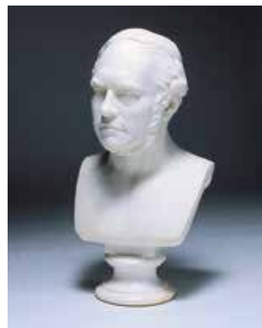
Jón Sigurðsson (1811–1879) var leiðtogi Íslendinga á fyrsta skeiði sjálfstæðisbaráttunnar. Starf hans bar ávöxt í fyrstu stjórnarskránni 1874. Honum til heiðurs var fæðingardagur hans, 17. júní, valinn sem stofndagur lýðveldisins 1944 og síðan þjóðhátíðardagur Íslendinga.

Kröfur almennings til áhrifa á stjórn ríkisins fóru vaxandi alla 19. öldina samhliða því sem þjóðerniskennnd eflist. Viðbrögð danska einvaldskonungsins, eins og margra