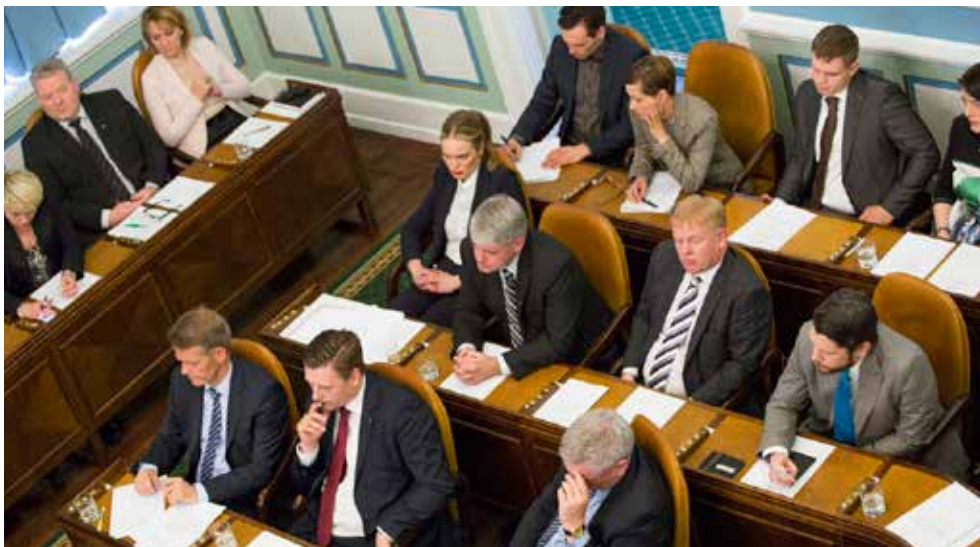
Á hausti hverju draga þingmenn, aðrir en forseti og ráðherrar, um sæti og eru notaðar til þess tölusettar kúlur.

Alþingistíðindi, öll þingskjöl og ræður ásamt öðru efni þingfunda, eru birt á vef Alþingis.