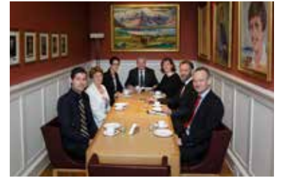
Forseti Alþingis og þingflokksformenn eiga að jafnaði fund vikulega á þingtímanum.

Oft heyrast athugasemdir um að þunnskipað sé á bekkjum Alþingis við umræður. Ástæðurnar geta verið ýmsar. Þingmenn hvers flokks skipta nokkuð með sér verkum og sérhæfa sig í vissum málaflokkum. Útsending frá þingfundum gerir mönnum kleift að