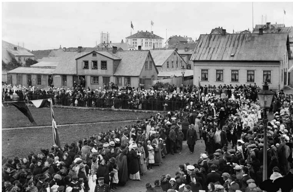
Konur fagna kosningarrétti þingsetningardaginn 7. júlí 1915 en kona náði ekki kjöri til þings fyrr en 1922. Í alþingiskosningunum 2013 náðu 25 konur kjöri og varð hlutfall þeirra þá 39,7%.