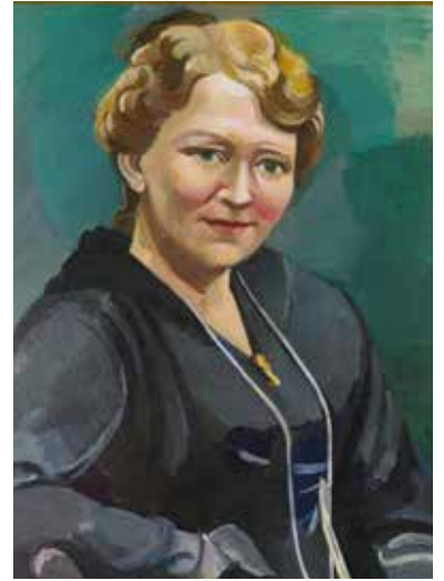
Fyrsta konan sem tók sæti á Alþingi var Ingibjörg H. Bjarnason (1867–1941). Hún sat á þingi árin 1922–1930.

Með sambandslögunum, sem tóku gildi 1. desember 1918, var Ísland viðurkennt fullvalda ríki í konungssambandi við Danmörku. Konungur varð að undirrita lög frá Alþingi til að þau tækju gildi en hafði neitunarvald samkvæmt stjórnarskránni. Konungur virti þingræðið og beitti því aldrei neitunarvaldi. Alþingi hafði löggjafarvald í öllum málum landsins en danska stjórnin fór áfram með utanríkismál. Starfshættir Alþingis breyttust hægt á næstu áratugum en sem dæmi um breytingar má nefna að frá árinu 1934 voru fjárlög afgreidd frá sameinuðu Alþingi í stað deilda.