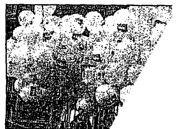
Blóðrur geta verið varfær heilum.

Þau tryggingafélög sem rætt var við á miðvikudag sögðust sum geta stundum boðið upp á sjúkdómatryggingar en þá væri krabbameinið undanþegið og því ekki tryggingaskyld þó einstaklingur fengi allt öðruvísi krabbamein, ótengt því sem hann var með. Flest tryggingafélög sögðu einnig að þeir sem höfðu eitt sinn verið með tryggingu, veikst og fengið þær borgaðar, gætu aldrei sjúkdómatryggt sig aftur. Einnig skal taka fram að sjúkdómatryggingin er nýtt fyrirbæri og aldrei hefur reynt á það áður að einstaklingur hafi reynt að tryggja sig á ný eftir veikindi.