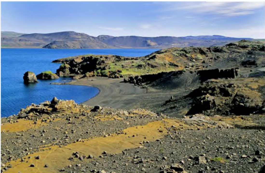
Mynd 3 Kleifarvatn er eina stóra stöðuvatnið í fólkvangnum.

Í fólkvangnum má sjá fjölbreytta eldgíga og fjöll mynduð við eldgos undir jökli. Einnig eru þar að finna þó nokkur merkileg gígvötn og tjarnir. Auk þess eru þar háhitasvæði með leirhverum, gufuaugum og vatnshverum.