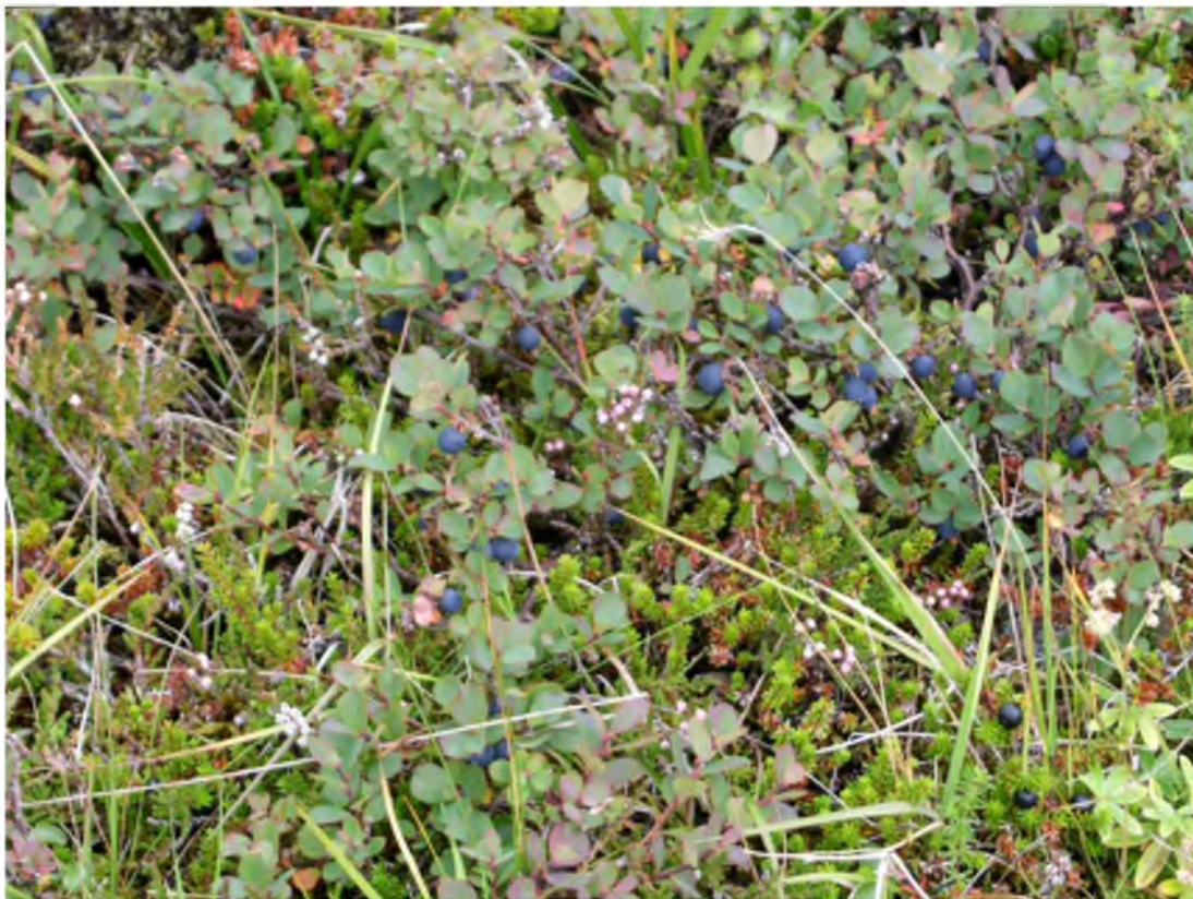
Mynd 31 Skipuleggja mætti grasaferðir í samvinnu við ferðaþjónustuaðila til þess að kynna gestum íslensku flórana.

Flóran í fólkvangnum er fjölbreytt og því þarf að koma upplýsingum á framfæri um helstu tegundir og vaxtarsvæði. Skilti með skýringarmyndum og markvissum texta hefðu mikið að segja.