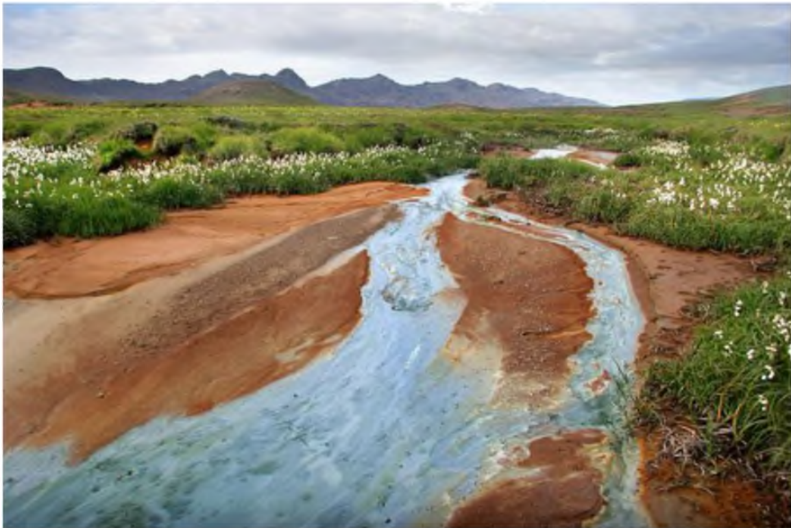
Mynd 7 Víða er áhugaverður gróður í votlendi við jarðhitasvæði, td. á Austurengjum (ELG)

Gróður er fjölbreyttur í votlendu. Helstu plöntur í mýrum eru gulstör, mýrastör, klófífa og hrafnaífa. Nykrur og mari vaxa m.a. í vötnum og tjörnum. Vert er að benda á svonefnd Augu, tvær litlar tjarnir sitthvoru megin við veginn sunnan Krýsuvíkur. Þar er að finna mjög fjölskrúðugan vatnagróður.