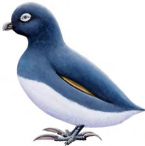
Mynd 13 Hverafuglar synda á sjóðandi heitum hverum án þess að verða meint af (JBH).

Fyrst ber að nefna hverafugla sem sagðir voru dvelja á jarðhitasvæðum. Þessar furðuverur áttu að halda til í Seltúni og á fleiri hverasvæðum. Þóttust menn oft sjá hverafugla syndandi á sjóðandi hverum en hurfu jafnharðan og menn nálguðust.