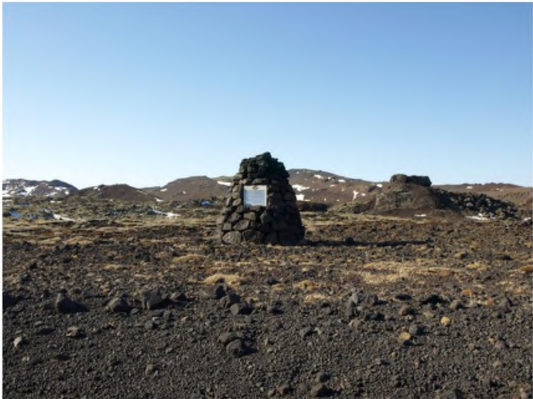
Mynd 21 Erfitt er að lesa á skilti vörðunnar frá veginum.