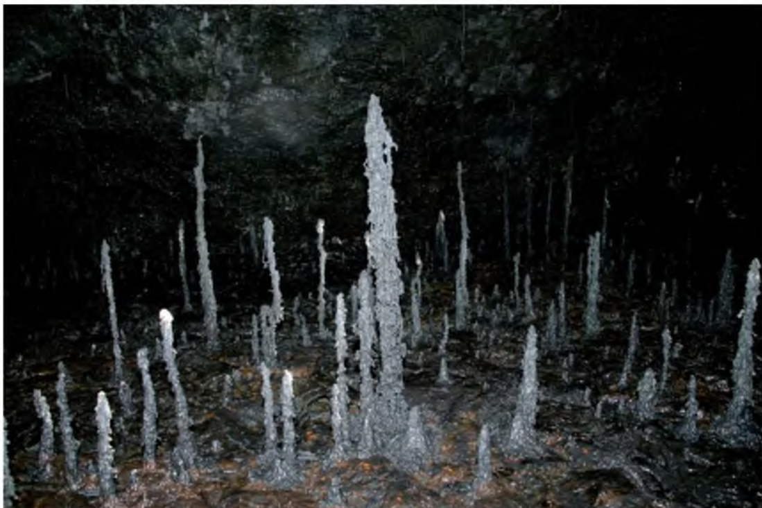
Mynd 30 Dropasteinar eru eitt helsta einkenni íslenskra hrauhella.

Því miður hefur hellirinn Leiðarenda látið á sjá vegna ágengni ferðalanga og er nauðsynlegt að reyna að leita leiða til að stemma stigu við skemmdum á hellinum og slysum á fólki á einhvern hátt án þess að fólki verði meinað að njóta fegurðar hellisins. Til að mynda uppi hugmyndir um að fólk eða fyrirtæki taki Leiðarenda í svokallað hellisfóstur.