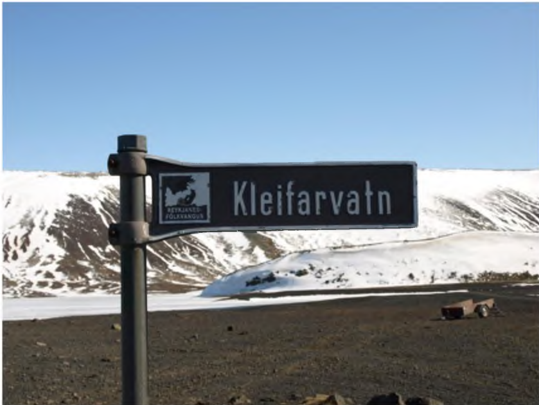
Mynd 22 Fólkvangsskiltin skera sig frá öðrum merkingum en mættu vera stærri og endurnýjunar er þörf á sumum stöðum.