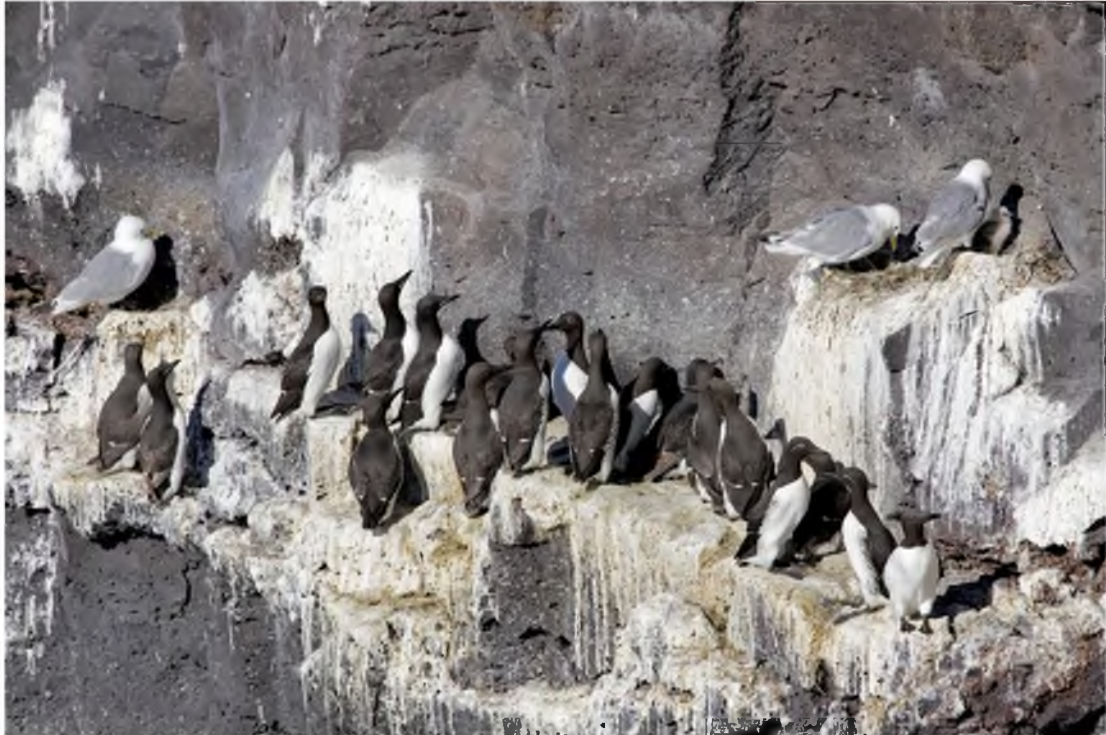
Mynd 9 Í Krýsuvíkurbergi verpa um 63.800 pör af 9 tegundum sjófugla.

Á brúnum bjargsins verpa bæði sendlingur og sólskríkja (snjótittlingur), en þessir fuglar eru annars algengastir á hálendinu. Maríuerla verpur og í bjarginu.