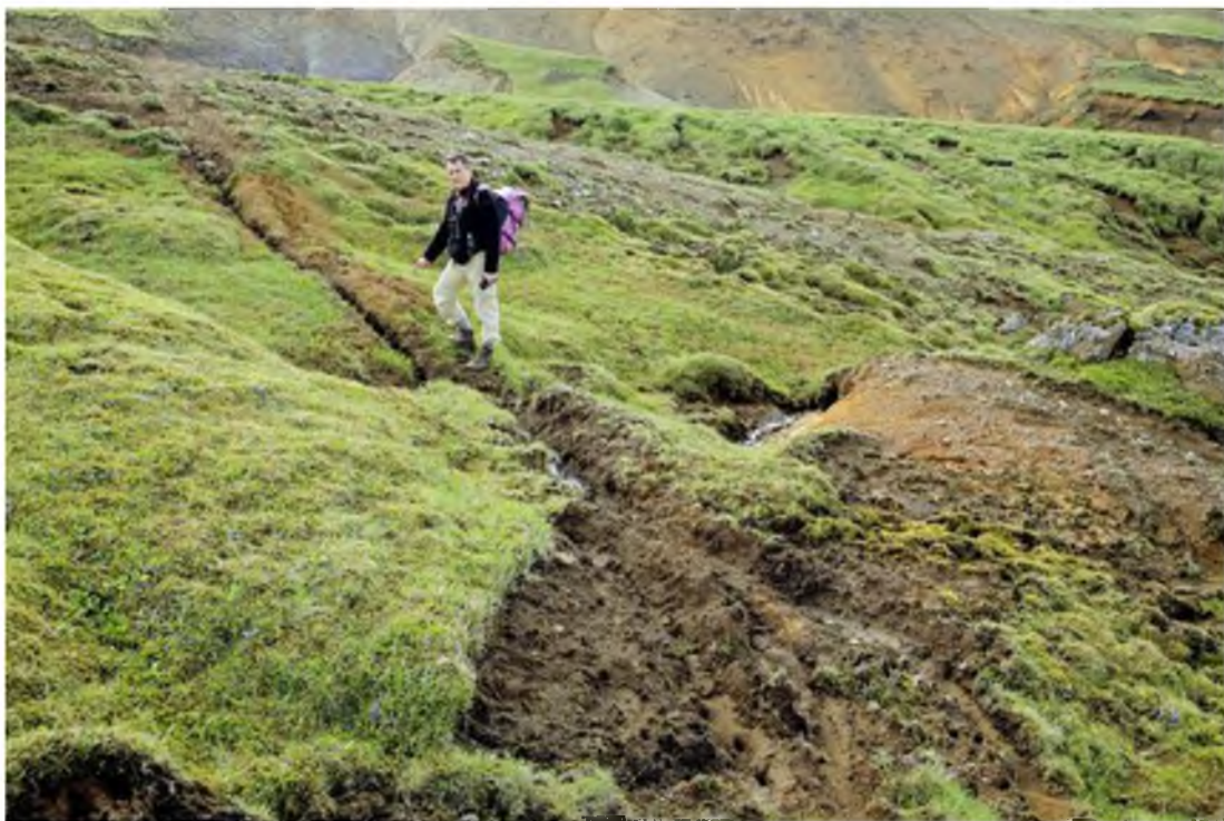
Mynd 15 Í fólkvangnum getur göngufólk fetað sig í friði og ró um grónar götur.

Gamlar þjóðleiðir lágu um hlað Krýsuvíkur. Almúgafólk, hefðarmenn, skólasveinar, förulýður, vinnuhjú og bændur sem áttu leið um Krýsuvíkurlörðina áttu þar öruggt skjól í misjöfnum veðrum. Gömlu leiðirnar eru enn sýnilegar þar sem þær liggja milli fjalls og fjöru, út á Suðurnes og inn til landsins. Þær hlykkjast gegnum hraunfláka, þræða sig meðfram vötum og fjallshlíðum, eða liggja yfir hæðir, hálsa og hæstu heiðar. Vörður, hlaðin skjól og aðrar mannvistarminjar vísa veginn. Göngufólk getur ennþá ratað þessar gömlu götur og fetað sig um gróna slóða fjarri skarkala þéttbýlisins, sem er samt svo skammt undan.