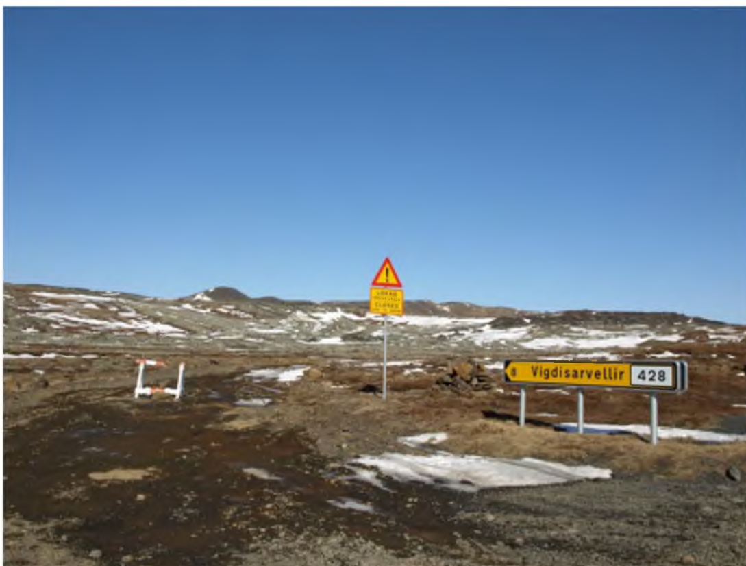
Mynd 17 Á veturna er vegurinn að Vigdísarvöllum lokaður og eingöngu fær stórum bílum á sumrin.

Um fólkvanginn liggja nokkrir akvegir. Aðalvegurinn er Krýsuvíkurvegur frá Vatnsskarði suður með Kleifarvatni að Krýsuvík og austur í Selvog. Einnig liggur um fólkvanginn Nesvegur, þjóðvegurinn á milli Krýsuvíkur og Grindavíkur. Auk þess Bláfjallavegur frá Krýsuvíkurvegi við Óbrynnishóla norður á Suðurlandsveg. Á sumrin opnast hringleið um suðurhluta fólkvangsins þegar Vigdísarvallavegur, sem liggur frá Vatnsskarði að Vigdísarvöllum og þaðan inn á Nesveg, er opnaður fyrir umferð.