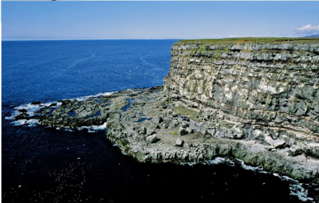
Mynd 8 Krýsuvíkurberg er á skrá yfir alþjóðlega mikilvæg fuglasvæði.

Krýsuvíkurberg er stærsta fuglabjarg frá Vestmannaeyjum og vestur um til Látrabjargs. Bjargið er á náttúruminjaskrá og skrá yfir alþjóðlega mikilvæg fuglasvæði. Í 1. töflu eru nýjustu tölur um varpfugla í Krýsuvíkurbergi. Þar verpa um 63.800 pör af 9 tegundum sjófugla.