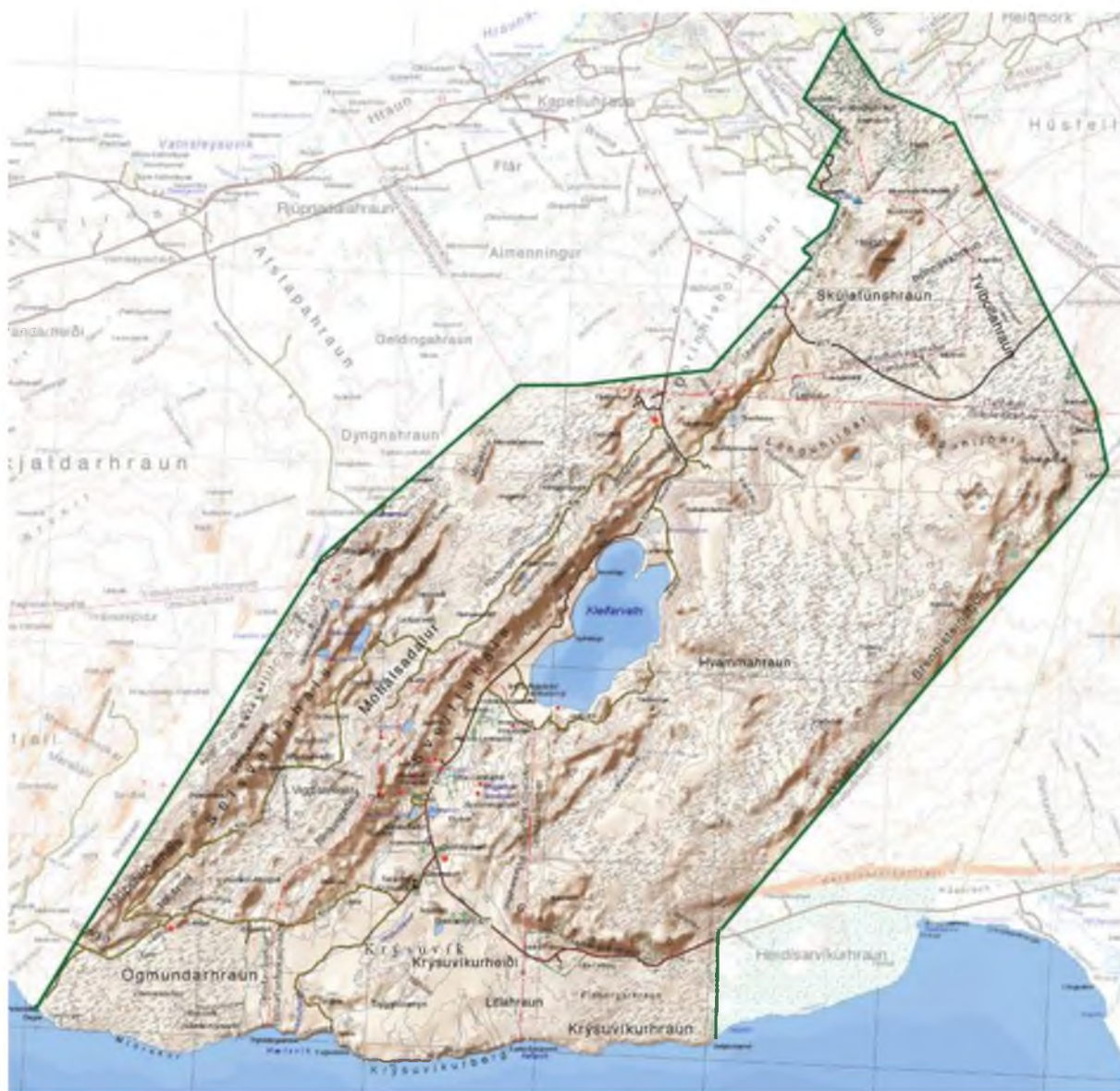
Mynd 1 Yfirlitskort af Reykjanesfólkvangi.

Fólkvangurinn spannar um 300 ferkílómetra og var til skamms tíma langstærsta friðlýsta svæði sinnar tegundar á Íslandi. Núverandi mörk hans taka mið af sýslumörkum Gullbringu- og Árnessýslu að austanverðu, norðurmörkin fylgja Bláfjallafólkvangi, vesturmörkin eru vestan Undirhlíða- og Núpshlíðarhálsa fram í sjó við Selatanga og suðurmörkin fylgja strandlínunni.