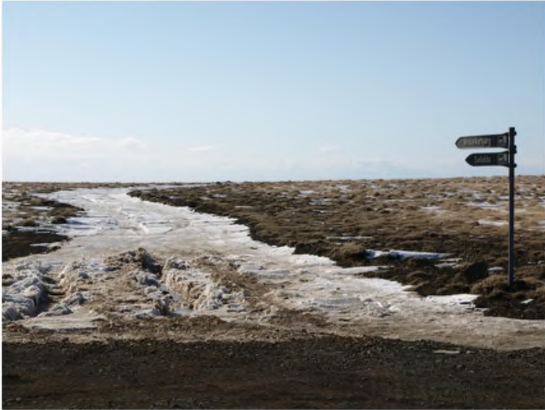
Mynd 18 Vegurinn út að Krýsuvíkurbergi er vægast sagt torfær.

Flestir veganna í fólkvangnum eru malarvegir og eru í misjöfnu ástandi. Sumir vegir og slóðar eins og vegur nr. 428, Vigdísarvallavegur, eru illa færir fólksbílum. Vigdísarvallavegur er tæplega fær nema góðum bílum og það eingöngu á sumrin. Á veturna er vegurinn lokaður. Sömu sögu er að segja um veginn út að Krýsuvíkurbergi sem er vægast sagt torfær.