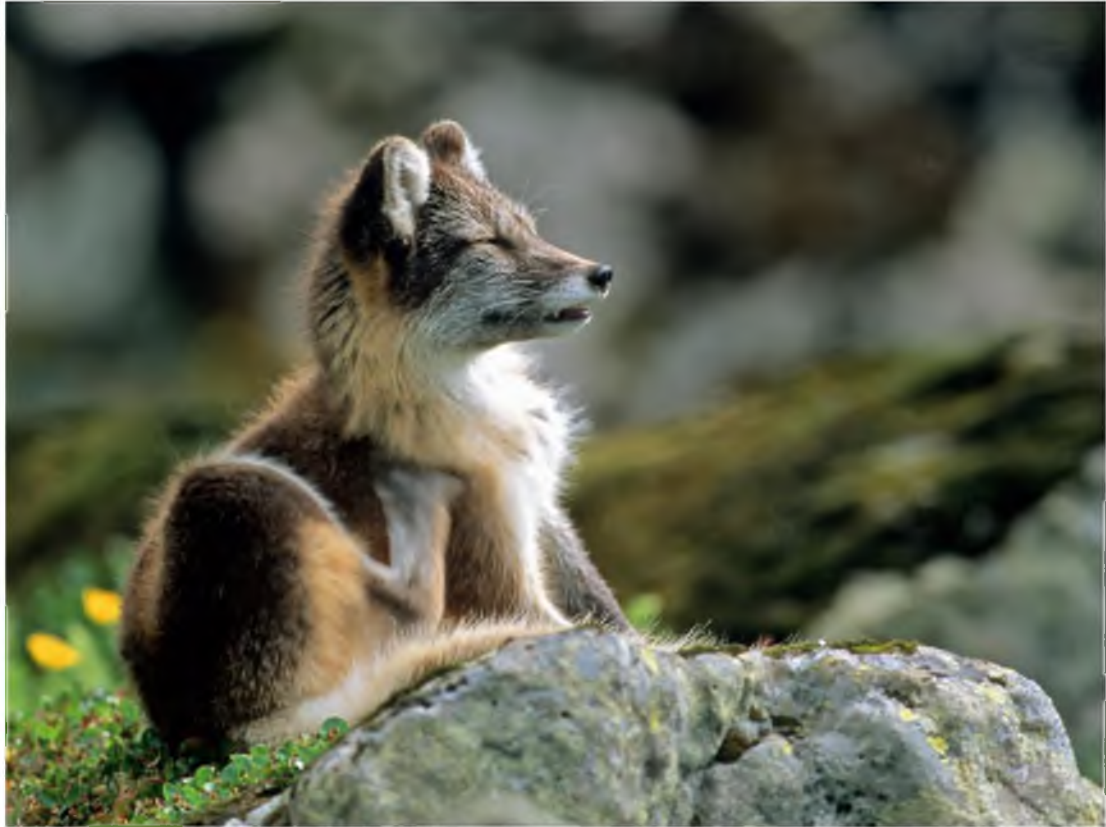
Mynd 11 Tófur má sjá víða í fólkvangnum.