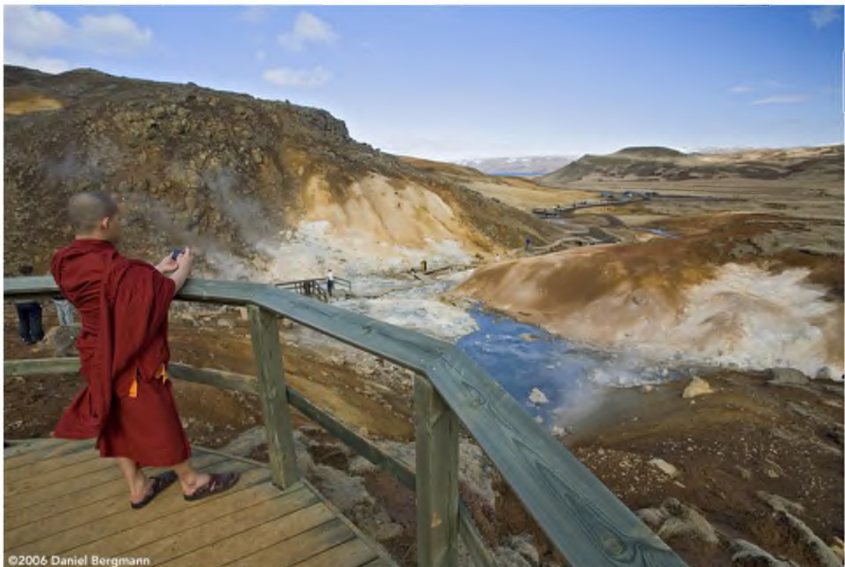
Mynd 24 Allir njóta þess að horfa á ólgandi leirhveru og hvæsandi gufuaugu (DB)

Það sem hefur verið talið upp hér varðandi bætt aðgengi og aðstöðu í Reykjanesfólkvangi er algjörlega nauðsynlegt ef hefja á fólkvanginn til vegs og virðingar sem eftirsóttá útivistarparadís fulla af möguleikum til uppbyggingar ferðaþjónustu.