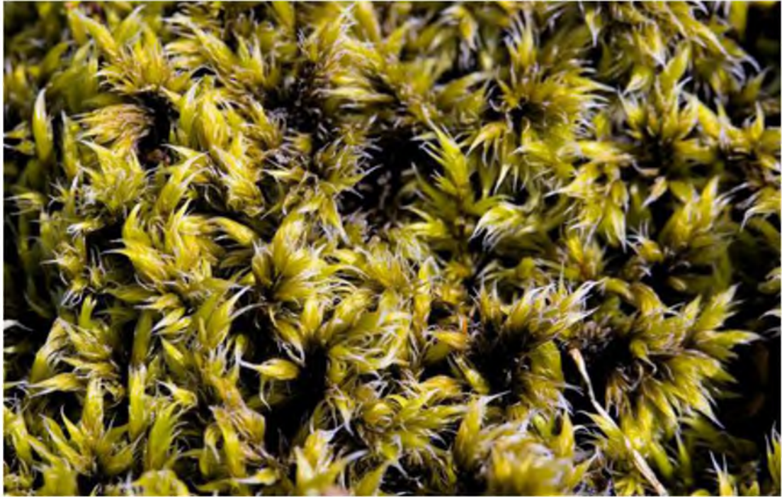
Mynd 5 Hraun með mosaþembu er að finna víðast hvar þar sem hraun hafa runnið. Hraungambri er algengur í fólkvangnum.