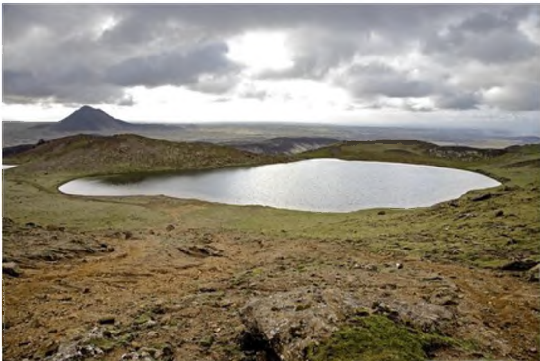
Mynd 10 Útsýni yfir Spákonuvatn.

Votlendi má finna á nokkrum öðrum stöðum í Reykjanesfólkvangi. Þau helstu eru við Djúpavatn, á Lækjarvöllum, við Arnarfell og í Bleiksmýri. Nokkur lítil vötn er að finna í fólkvangnum, tvö Grænuvötn, Spákonuvatn, Arnarvatn og Geststaðavatn eru þau helstu. Mýrlendi er takmarkað við flest þeirra.