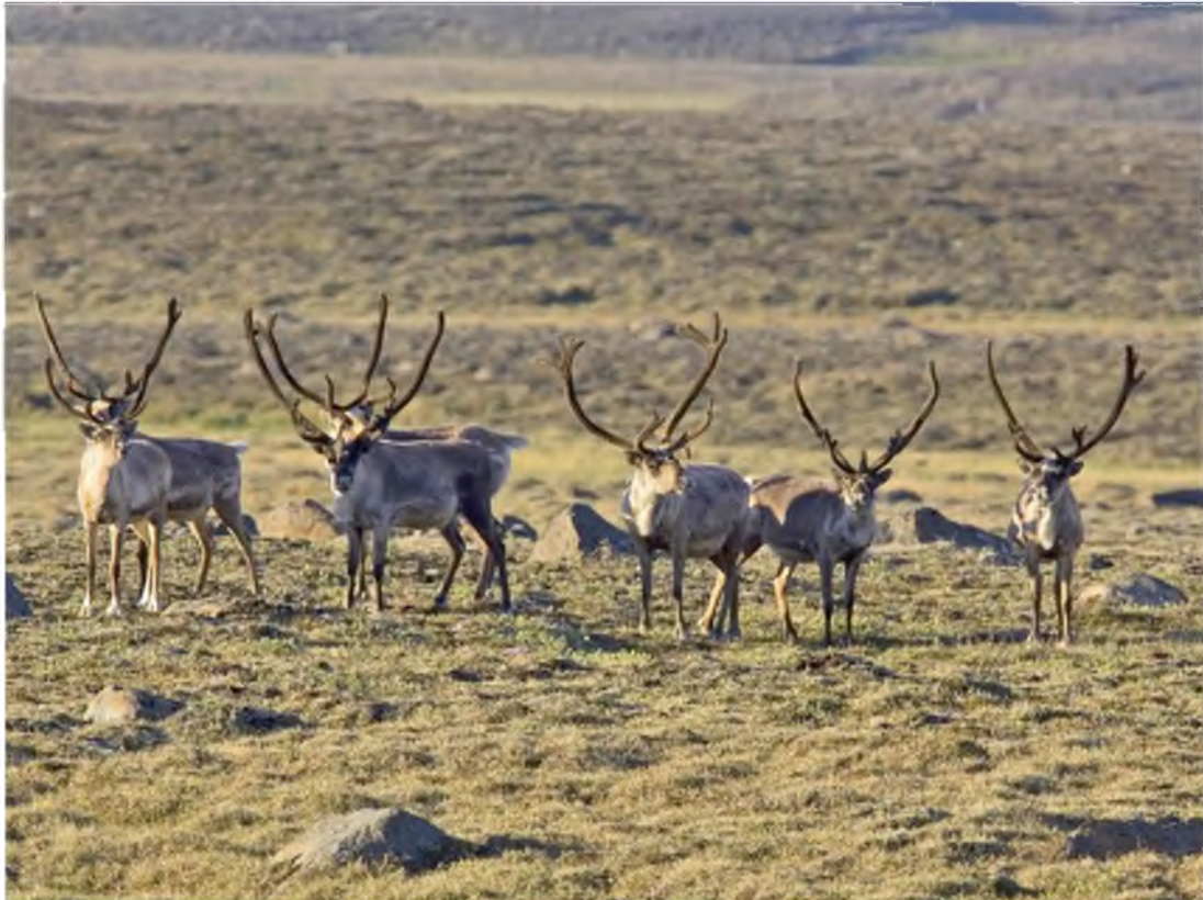
Mynd 12 Hreindýr héldust við á Reykjanesi í rúmlega eina og hálfu öld.