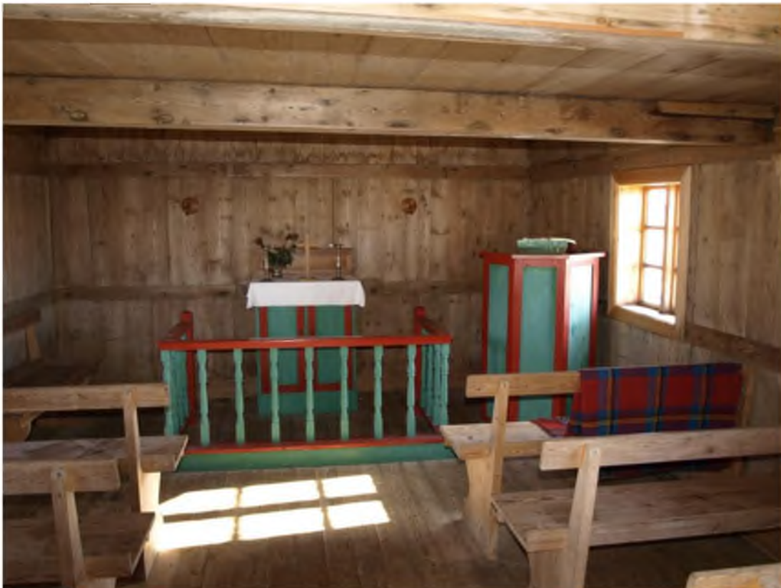
Mynd 16 Gestabækur Krýsuvíkurkirkju bera miklum gestagangi í fólkvangnum glöggt vitni.