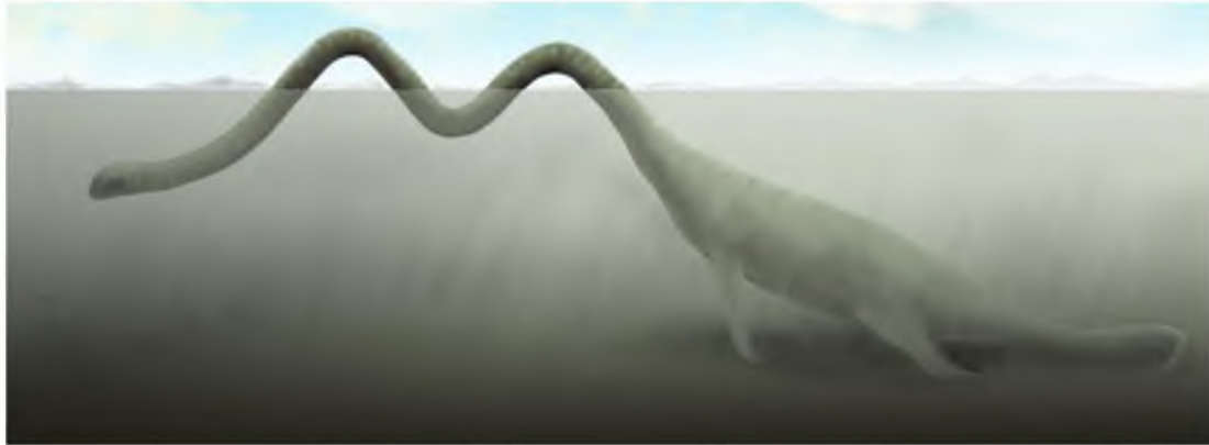
Mynd 14 Skrímslið í Kleifarvatni er talið vera um 30-40 m langt (JBH).