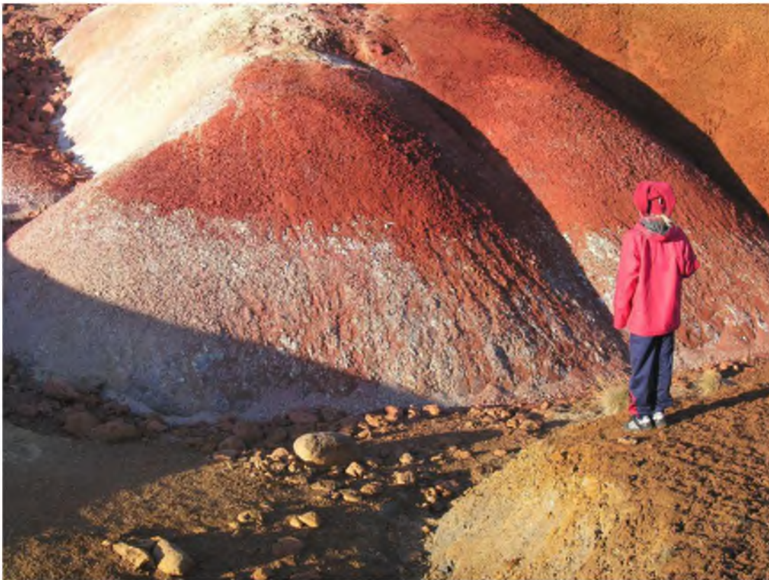
Mynd 26 Í náttúruskóla komast nemendur í návígi við undur veraldar.

Nálægð Reykjanesfólkvangs við Keflavíkurlugvöll eykur svo enn á möguleika til markaðssetningar fræðslunnar til erlendra stúdenta en nú þegar koma hundruð nemenda erlendis frá á ári hverju til að nema jarðfræði í Reykjanesfólkvangi. Fjölbreytt náttúrufar og einstök jarðfræðisaga svæðisins er grundvöllur að uppbyggingu fræðslu sem ekki er aðgengileg með sama hætti annars staðar. Með aukinni þekkingu á umhverfinu er einstaklingurinn betur í stakk búinn til að taka meðvitaðar ákvarðarnir er varða umhverfi hans. Aukinn áhugi er á hvers konar fræðslutengdri afþreyingu í þjóðgörðum og friðlýstum svæðum. Þekking almennings á gildi þess að hafa aðgengi að óspilltu umhverfi sér til heilsubótar og fræðslu fer einnig vaxandi.