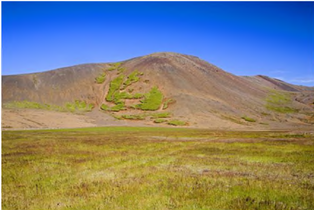
Mynd 4 Fjöllin í fólkvangnum eru misvel gróin.

Eva Guðný Þorvaldsdóttir kannaði og kortlagði flóru og gróðurfar í fólkvangnum á árunum 1980 og 1981. Hún flokkaði land fólkvangsins í 13 gerðir gróðurlendis: mosapembu 45% af flatarmáli fólkvangsins, mólendi 14%, graslendi 2%, kjarr 1%, votlendi 1%, bersvæðisgróður 11,5%, sáðland 0,5%, snjóðældagróður, jarðhitagróður, strand-gróður, hraunsprungugróður, skógrækt og loks ógróið land sem er 21 % af flatarmáli fólkvangsins. Ástand gróðurs er víða slæmt, aðallega vegna ofbeitar og uppblásturs. Mikið hefur dregið úr beit á síðustu áratugum og jafnframt hefur verið gerð gangskör í uppgræðslu og hafa Landgræðslan og samtökin Gróður fyrir fólk í landnámi Ingólfs verið atkvæðamest.