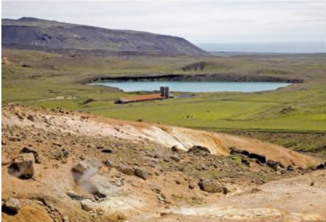
Mynd 28 Grænavatn er vinsæll staður til stjörnuskoðunar.

Undanfarin misseri hafa félagsmenn í Stjörnuskoðunarfélaginu stundað stjörnuskoðun við Grænavatn í Krýsuvík með góðum árangri. Í Krýsuvík er myrkur með því besta sem gerist á Suðurlandi og aðstæður þar oftast hinar ákjósanlegustu. Krýsuvík er nógu langt frá borg og bæjum til að ljósmengun frá þeim komi ekki í veg fyrir að daufustu vetrarbrautir sjáist og fínustu smáatriði á reikistjörnunum séu sýnileg, en nógu stutt svo hægt er að fara þangað með skólahópa án mikils tilkostnaðar. Í raun er Krýsuvík meðal bestu staða á landinu fyrir stjörnuáhugafólk að virða fyrir sér óspilltan næturhimininn. Útsýni til suðurs er algjörlega óheft frá Krýsuvík, nokkuð sem er stjörnuáhugafólki mjög mikill hagur í. Segja má að Krýsuvík sé vin í ljósmengunareyðimörkinni.