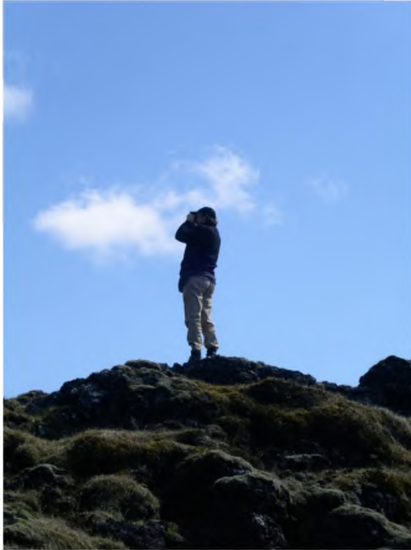
Mynd 27 Reykjanesfólkvangur er tilvalinn staður til fuglaskoðunar.

Áhugi á fuglaskoðun hefur stóraukist á síðustu árum eins og sjá má á fjölgun einstaklinga í ýmsum fuglaverndarfélögum hér á landi jafnt og erlendis og eftir því sem stafrænni tækni fleygir fram, fjölgar áhuga- og atvinnumönnum í fuglaljósmyndum. Það mætti bjóða þessum hópum upp á skipulagðar skoðunar- og ljósmyndaferðir um fólkvanginn og jafnvel mætti koma upp fuglaskoðunarskýlum á vinsælustu fuglastöðum til að auðvelda fuglavinum að skoða fiðurfénaðinn. Þessi hópur fólks er því einn af þeim ört stækkandi markhópum sem ætti að laðast að fólkvangnum ef rétt er haldið á spilunum.