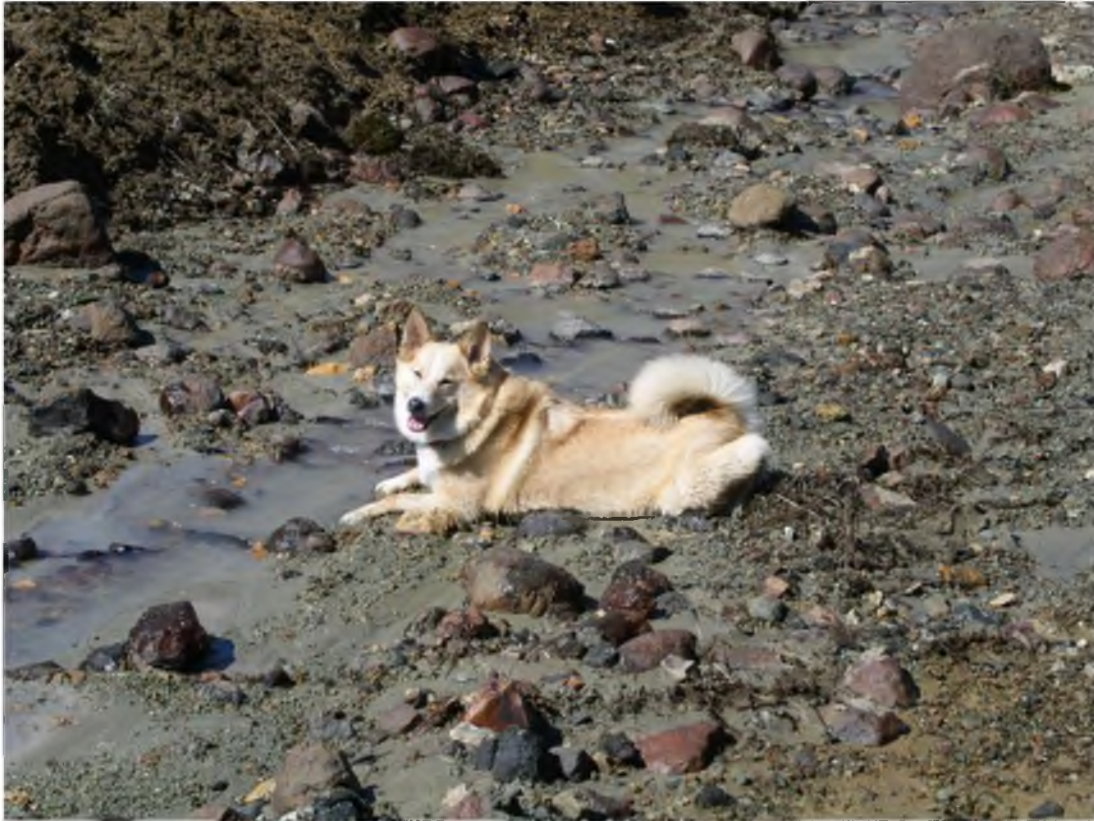
Mynd 32 Tilvalið er að fara með fjölskylduhundinn í gönguferð í fólkvangnum.

Göngu- og hjólaleiðir bjóða upp á margvíslega líkamsrækt og skemmtun. Hjólaferð um Reykjanesfólkvang er upplifun sem enginn ætti að láta fram hjá sér fara. Fjölbreytt umhverfið er hvetjandi og allir ættu að geta fundið afþreyingu við sitt hæfi. Skipulagðar hjóla- og/eða gönguferðir, hjólamarabon á slóðum fyrir vana hjólreiðamenn, kraftganga um fjöll og firnindi eða dagsferð með nesti í faðmi fjölskyldunnar mætti nefna sem dæmi.