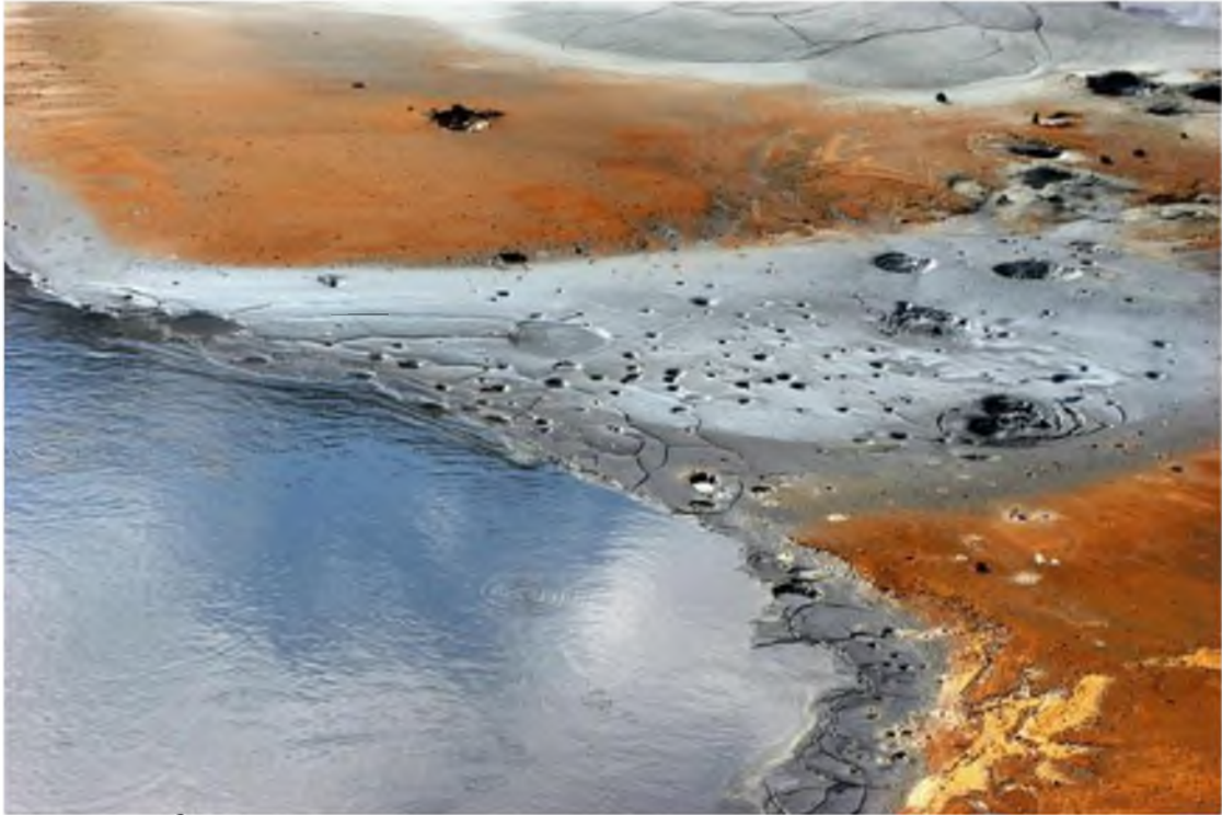
Mynd 2 Í fólkvangnum eru háhitasvæði með leirhverum, gufuaugum og vatnshverum (ELG).

Í fólkvangnum má sjá fjölbreytta eldgíga og fjöll mynduð við eldgos undir jökli. Einnig eru þar að finna þó nokkur merkileg gígvötn og tjarnir. Auk þess eru þar háhitasvæði með leirhverum, gufuaugum og vatnshverum.