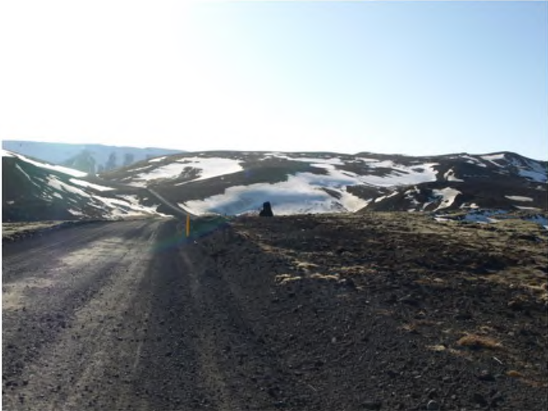
Mynd 20 Varða sem markar aðkomu að fólkvangnum frá Hafnarfirði.