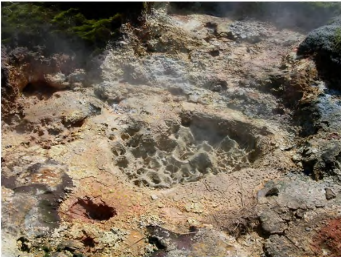
Mynd 25 Margt ber fyrir augu á jarðhitasvæðunum við Trölladyngju.

Á Reykjanesskaga eru nokkur háhitasvæði: Reykjanes, Eldvörp, Svartsengi, Sandfell, Trölladyngja, Krýsuvík, Brennisteinsfjöll og Hengilssvæðið. Umtalsverð orkuvinnsla er þegar til staðar á svæðunum austast og vestast á skaganum. Helst er skynsamlegt að þróa áfram nýtingu jarðvarmans á þeim svæðum sem þegar hafa verið virkjuð að hluta. Leggja þarf áherslu á rannsóknir og djúpboranir sem gætu margfaldað orkuvinnslugetu þessara svæða.