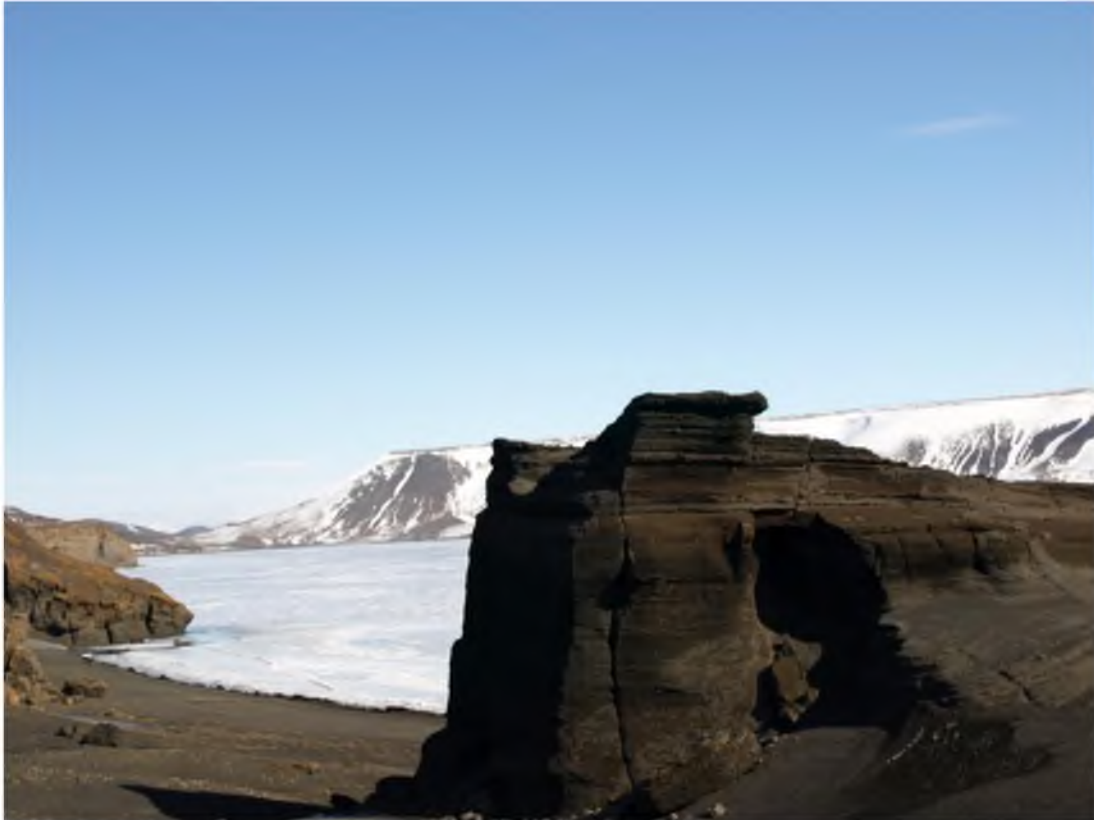
Mynd 19 Fjölga mætti áningarstöðum eða litlum útskotum við vinsæla staði.

Þá þarf að fjölga útskotum eða litlum bílastæðum við vinsælar gönguleiðir til að tryggja gott aðgengi að útivistarperlum og fagurri náttúru. Enn sem komið er fer lítið fyrir slíku við margar gönguleiðir og aðra markverða staði og skapar það hættu á gróðurskemmdum þar sem fólk freistast til að leggja bílum sínum í vegarköntum eða utan vega. Þessi skortur á útskotum gerir það að verkum að margir gestanna sjá sér ekki fært að skoða þá staði sem þeir hefðu ella stansað við. Skortur á útskotum og litlum bílastæðum felur aukinheldur í sér stórauðna slyshættu, sér í lagi þar sem bílaumferð um fólkvanginn mun án efa einungis aukast í framtíðinni. Núverandi Suðurstrandarvegur býður ekki upp á að hægt sé að beygja út af eða stoppa rútu á áningarstöðum nema að leggja fólk í hættu á miðjum vegi. Þetta er afar mikilvægt að laga. Einnig þarf að kortleggja áningarstaði við Suðurstrandarveg og hafa þá klára strax við lagningu vegarins.