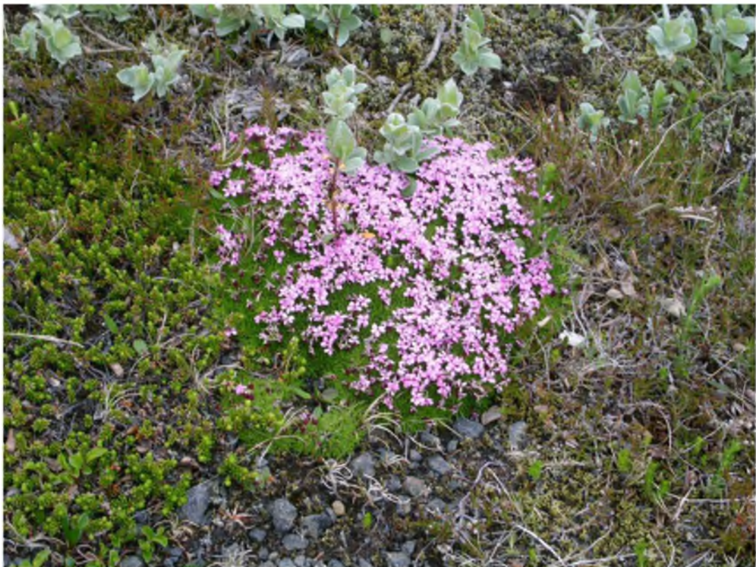
Mynd 6 Á sumrin má finna litskrúðugar blómplöntur í fólkvangnum.