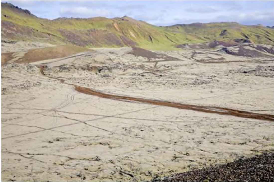
Mynd 23 Utanvegaakstur hefur víða skilið eftir ljót sár í landslagi fólkvangsins.

Einnig gæti starfsmaðurinn sinnt almennri fræðslu um fólkvanginn fyrst um sinn en heppilegast væri að í fyllingu tímans yrði ráðinn einn landvörður og einn fræðslufulltrúi í fólkvanginn auk sumarstarfsmanna sem myndu sinna almennu viðhaldi í fólkvangnum yfir sumartímann.