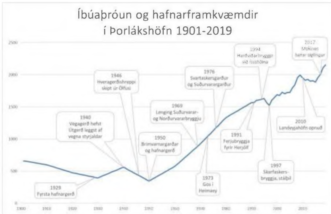
Mynd 1: Íbúapróun og hafnarframkvæmdir í Þorlákshöfn.

Í apríl árið 2017 hófust siglingar þekjuferjunnar Mykines til Þorlákshafnar á vegum Smyril Line Cargo. Skipið siglir vikulega á milli Rotterdam í Hollandi, Þórshafnar í Færeyjum og Þorlákshafnar. Þorlákshöfn hefur sannað sig sem góður valkostur fyrir vöru- og farþegaflutninga með ferjum og skapað sér ákveðna sérstöðu á vöruflutningamarkaðinum. Á síðustu árum hefur fjölgað komum svokallaðra búlkara (e. Bulk Carriers), þ.e. skipa sem sigla með einsleitum farm í miklu magni, s.s. vikur, áburð, lýsi eða korn. Slíkar siglingar eru yfirleitt ekki bundnar áætlunum og því óreglulegri en ferjusiglingar.