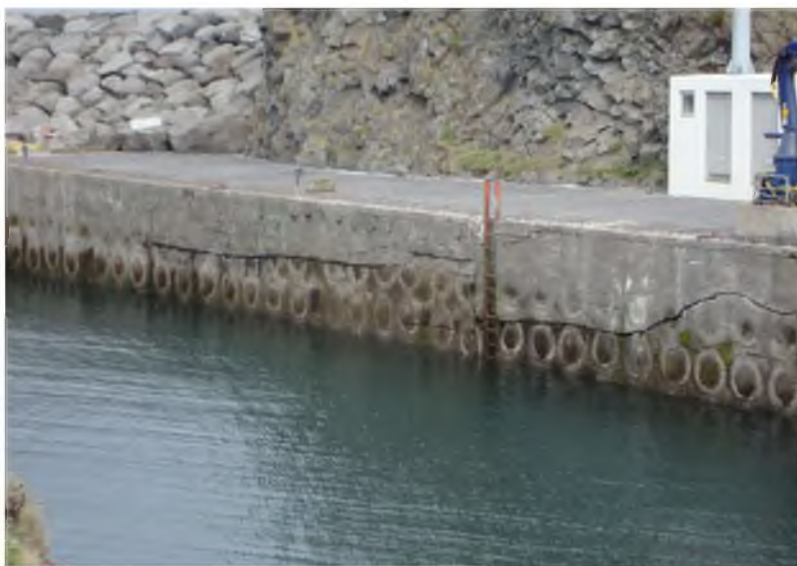
Mynd 1: Mynd af sambærilegri kerjabryggju á Arnarstapa

Eldra kerin frá árinu 1958 er þar fyrir innan 12 m. á lengd og breidd, hólfaskipt með 9 hólfum. Þykkt útveggja á þeim hluta er 30 cm. og milliveggja 15 cm.