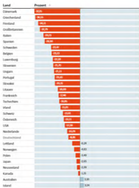
Figure 1 2005 - 2017 jókst losun gróðurhúsalofttegunda hlutfallslega mest meðal iðríkja.