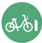
Station-based bike share (including e-bikes)

Shared Micromobility encompasses all shared-use fleets of small, fully or partially human-powered vehicles such as bikes, e-bikes, and e-scooters.