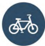
Dockless bike share (including e-bikes)