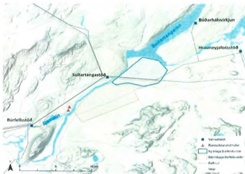
Mynd 1: Fyrirhugað framkvæmdasvæði Búrfellslundar

Í ljósi þeirra breytinga sem hafa verið gerðar á verkefninu og tafa sem orðið hafa á afgreiðslu 3. áfanga rammaáætlunar, telur Landsvirkjun eðlilegt að horfa til nýrrar útfærslu Búrfellslundar í stað eldri útfærslu þegar 3. áfangi rammaáætlunar er tekinn til umræðu á Alþingi. Að öllu jöfnu telur Landsvirkjun að ný útfærsla Búrfellslundar, með fyrrnefndum breytingum, hefði í för með sér breytta áhrifaefni hjá faghópi 2 sem ein og sér dugur til að flokka virkjunarkostinn í nýtingarflokk.