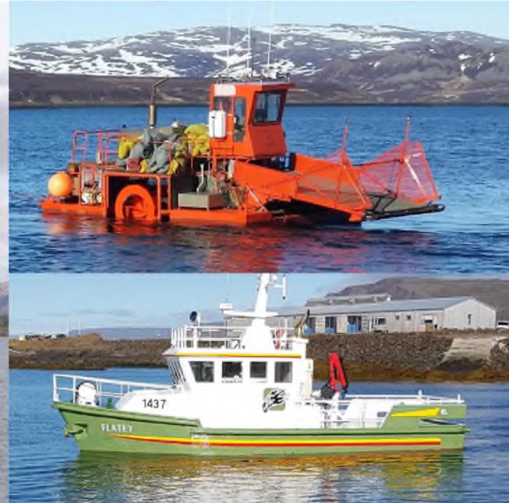
Flatey og Karlsey, þjónustubátar