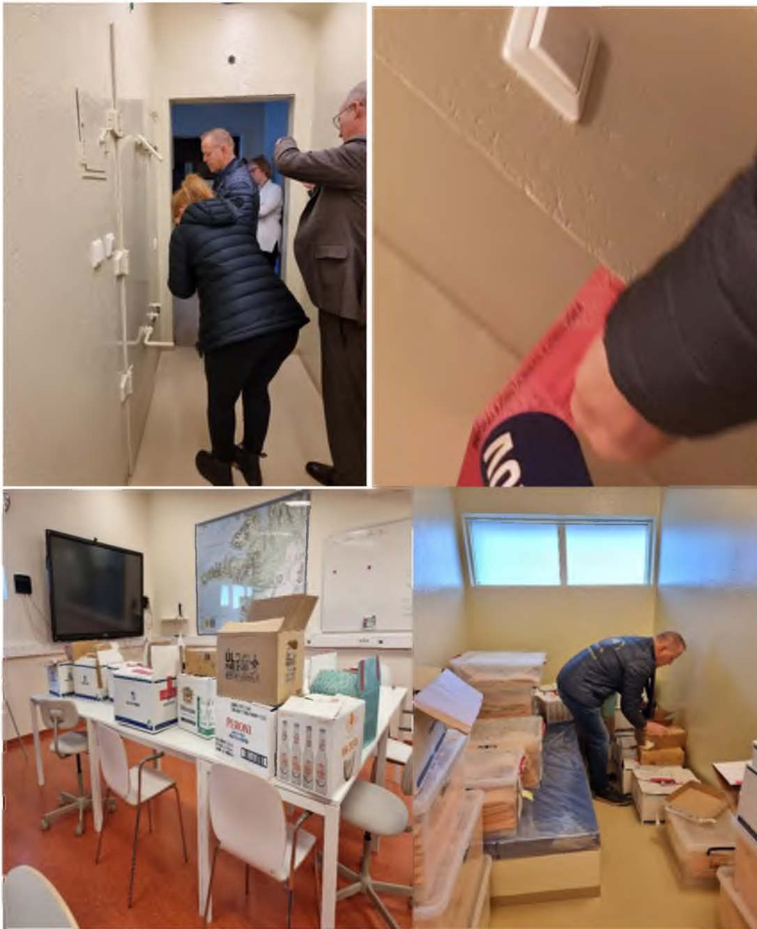
Kl. 09:42 var fangaklefi innsiglaður að nýju af BLP með einu innsigli (K00007157).