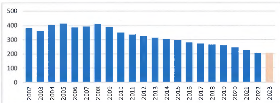
Mynd 2. Framlög til Atvinnuráðgjafa á landsbyggðinni á verðlagi í júlí 2022 í m.kr miðað við launavísitölu

Eins og sjá má á mynd 1. hafa fjárframlög hækkað í krónum talið á tímabilinu 2002 til 2022. Séu framlögin hins vegar framreiknuð miðað við launavísitölu í júlí 2022 er ljóst að framlögin hafa lækkað að raunvirði. Frá árinu 2009 til 2022 hefur framlagið lækkað úr 398 m.kr. í 200 m.kr. eða um 50% (mynd 2). Þar sem laun eru meginkostnaðarliðurinn hjá landshlutasamtökunum má m.ö.o. segja að framlagið 2009 hafi dugað til að hafa 33 ráðgjafa í vinnu en 2022 einungis 17. Áætlaður heildarkostnaður á starfsmann er 12 m.kr. með launatengdum gjöldum og öðrum kostnaði.