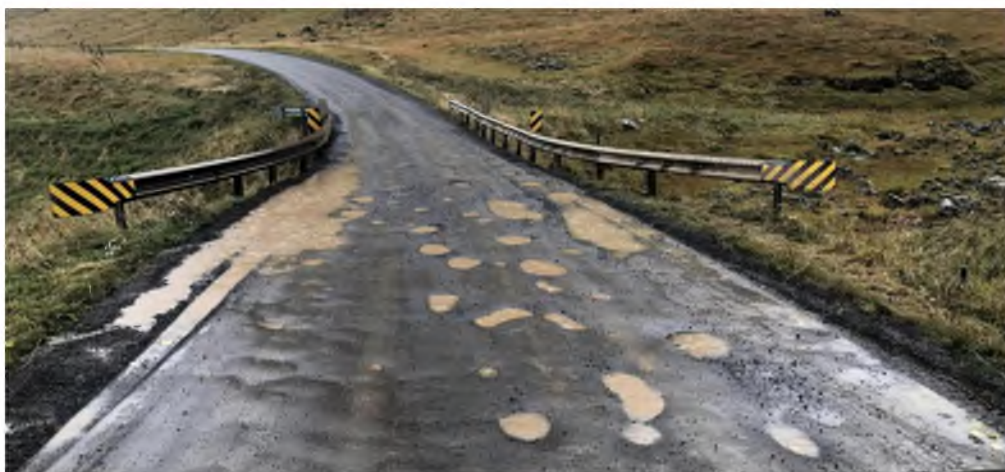
Dæmigert ástand malarvega á blautu hausti, mynd tekin á Skarðsströnd (Klofningsvegi)

Einnig var skoðuð dreifing atvinnurekstrar, þar var bæði stuðst við gögn um fyrirtækjaskráningu og eins var rekstur einyrkja tekinn með í reikninginn. Fyrirvari á fyrirtækjaskráningum er sá að tölur voru frá 2019/2020 og því gætu hafa orðið einhverjar breytingar á. Breytingar voru gerðar þar sem vitað var um t.d. tilfærslu heimilisfanga/flutning og/eða nýjan eða aflagðan rekstur. Niðurstaðan er sú að við langflesta vegakafla í Dalabyggð er að finna atvinnurekstur í einhverri mynd.