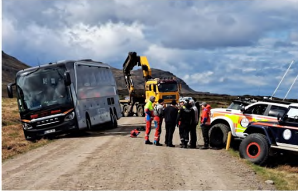
Frá umferðaróhappi á Snæfellsnesvegi (Skógarstrandarvegi), 04.06.2023

Ár hvert gefur Vegagerðin út umferðartölur fyrir mest allt þjóðvegakerfið, þó yfirleitt ekki á héraðsvegum. Þessar umferðartölur eru gefnar upp sem meðaltöl fyrir ákveðna lengd innan hvers vegar m.ö.o. hvert meðaltal gildir bara fyrir ákveðna lengd innan hvers vegar, vegkafla eða stall. Þannig er tiltekin árdagsumferð (ÁDU) þ.e. meðalumferð á dag yfir árið, sumardagsumferð (SDU) þ.e. meðalumferð á dag mánuðina júní - september og vetrardagsumferð (VDU) þ.e. meðalumferð á dag mánuðina janúar - mars og desember. Hægt er að skoða þessar tölur í fyrrnefndri vefsíðu Vegagerðarinnar.