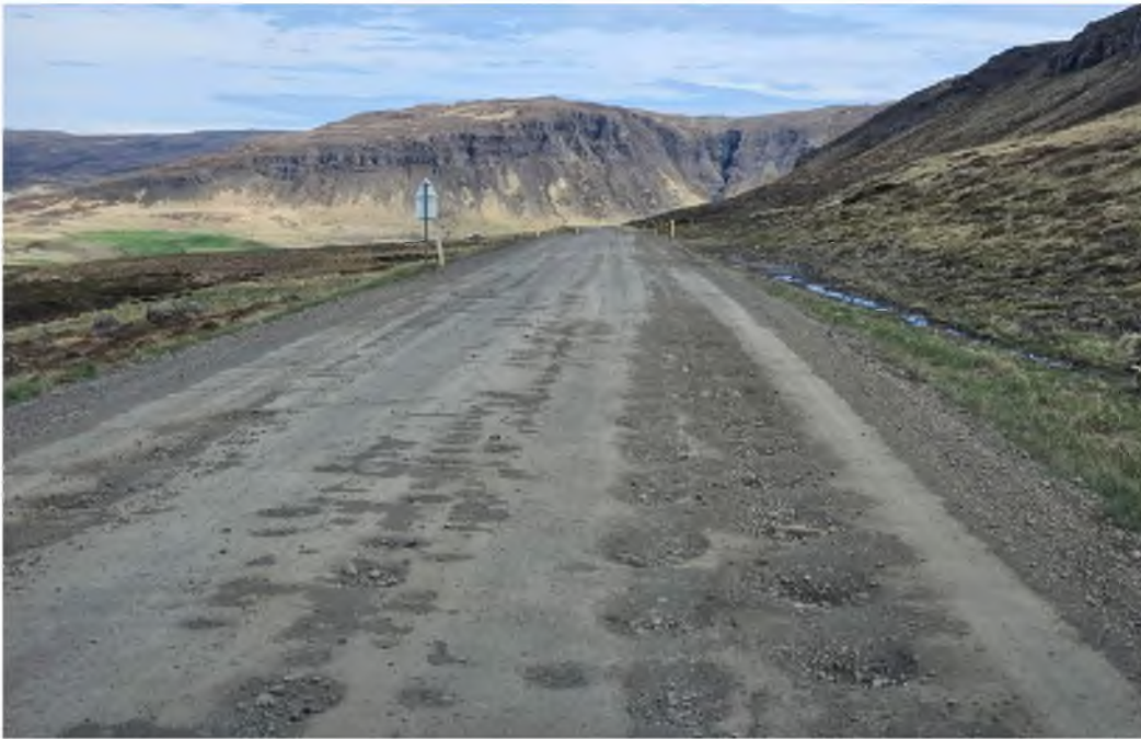
Mynd tekin rétt hjá Narfeyri á Snæfellsnesvegi (nr. 54)

Af þessum 18 köflum undir vegum með tveggja stafa númer eru aðeins 11 sem eru slitlagðir að fullu, 3 sem eru með slitlag að hluta til (þá við lögbýli á leiðinni) og 3 sem eru án alls slitlags. Þess má geta að verið er að vinna í einum af þessum köflum, þ.e. framkvæmdir við Snæfellsveg/Skógarströnd sem áður hafa verið nefndar. Þegar skoðaðir eru vegir með þriggja stafa númer minnkar hlutfall slitlags, þar er aðeins einn vegkaflí sem hefur slitlag að fullu, fjórir sem hafa bæði (s.s. slitlag við bæi) en 14 sem enn eru aðeins malarvegir. Hlutfall slitlags er svo enn minna þegar skoðaðir eru vegir með fjögurra stafa númer. Það ber að athuga að slitlag í þessum skilningi er ekki endilega í fullri breidd.