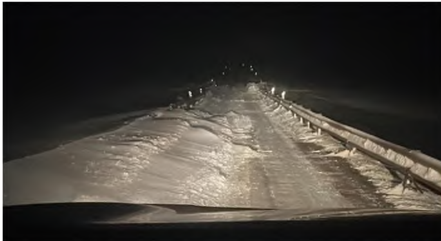
Mynd tekin sl. vetur við einbreiða brú á Laxárdalsheiði.

Dalabyggð er áfram um verkefni stjórnvalda við að fækka einbreiðum brúm og vill benda á að nokkrar brýr í Dalabyggð væri hægt að leggja niður með minni tilkostnaði heldur en að byggja nýja tvíbreiða, þ.e. með því að leggja stálræsi eða svokölluð hálfbogaráesi í staðinn. Má þar nefna eftirfarandi: Á vegi nr. 59, Hólkotsá í Laxárdal, Skeggjagil í Laxárdal, Laxá á Laxárdalsheiði, á vegi nr. 55 Þverá og Hraunholtaá, á vegi nr. 585 Svínhólgil, á nr. 5845 Saurstaðagil, á vegi nr. 593 Helluá, vegur nr. 590 Nípurá, á vegi nr. 690 Kleifaá og á vegi nr. 587 Ljá.