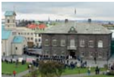
Alþingishúsið stendur við Austurvöll. Það var reist á árunum 1880–1881.

Í stjórnarskrá lýðveldisins Íslands er á því byggt að uppspretta valds sé hjá fólkinu sem felur kjörnum fulltrúum meðferð þess valds. Kjósendur velja fjórða hvert ár í almennum leynilegum kosningum 63 þingmenn til setu á Alþingi. Þeir fara sameiginlega með vald til að setja þegnum landsins lög auk þess sem þeir fara með fjárstjórnarvald, þ.e. vald til að ákveða útgjöld ríkisins og þá skatta sem lagðir eru á landsmenn. Mikilvægt er að fólk viti hvaða ákvarðanir eru teknar á Alþingi og hvernig þær eru teknar því að kjósendur og fulltrúar þeirra bera ábyrgð á að varðveita virkt lýðræði. Segja má að kosningarrétturinn sé undirstaða lýðræðis á Íslandi og að Alþingi sé hornsteinn þess lýðræðis.