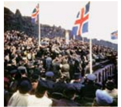
Viðhafnarmestu þjóðarbátidír eru baldnar á Þingvöllum. Þar var minnst 1000 ára Íslandsbyggðar 1874, 11 alda byggðar 1974 og 1000 ára afmælis Alþingis 1930. Lýðveldi var stofnað á Þingvöllum 1944 (mynd að ofan) og var hálfra aldar afmælis þess minnst 1994. Sumarið 2000 var þar minnst kristni-tökunnar á Alþingi árið 1000.

Meginbreytingar urðu á skipan Alþingis með stjórnarskrárbreytingu í maí 1991. Þingið starfar nú í einni málstofu. Breytingin kallaði á talsverða endurskoðun þingskapa. Þingnefndir eru nú 12 talsins, skipaðar níu mönnum hver nema fjárlaganefnd; í henni eiga 11 þingmenn sæti.