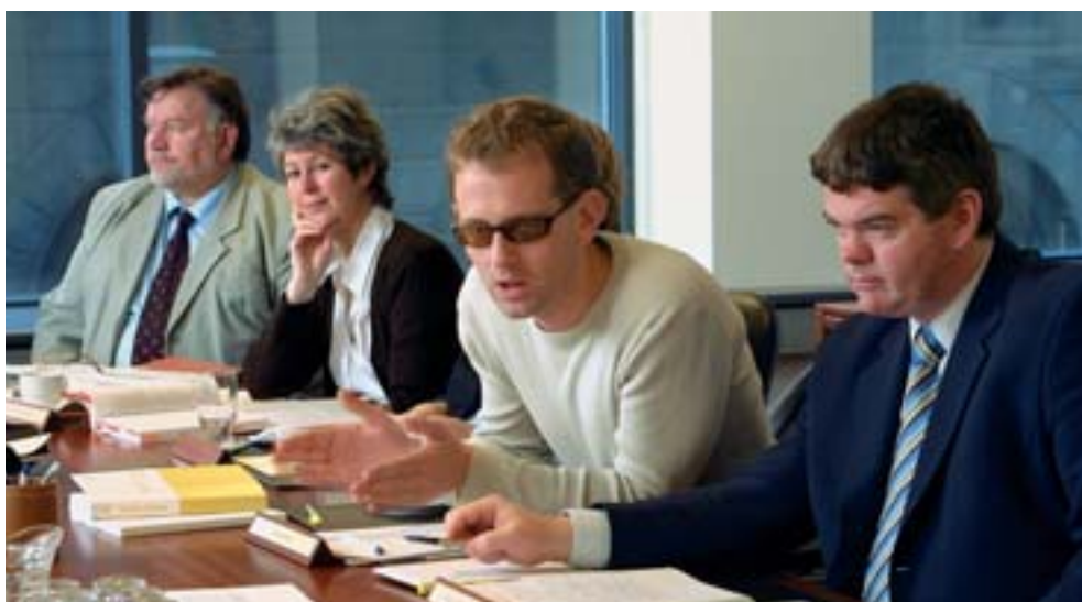
Frá fundi í fjárlaganefnd. Lagafrumvörpum og þingsályktunartillögum er vísað til nefndar eftir 1. umræðu.

Á skýringarteikningunni hér að ofan getur að líta feril lagafrumvarps. Eftir því sem á meðferð málsins líður verður athugun þess æ gaumgæfilegri. Við 1. umræðu á að ræða frumvarpið í stórum dráttum. Að henni lokinni er málinu vísað til nefndar sem fer yfir málið í smáatriðum og kallar á fund sinn sérfræðinga og hagsmunaaðila. Þegar nefndin hefur skilað nefndaráliti fer fram 2. umræða og á þá að ræða einstakar greinar frumvarpsins og breytingartillögur við þær og loks eru greidd atkvæði um þær. Við 3. umræðu er rætt um frumvarpið í heild sinni og við lok hennar ræðst í atkvæðagreiðslu hvort frumvarpið verður að lögum. Því sem næst helmingur frumvarpa, sem lögð eru fyrir Alþingi, hlýtur að jafnaði samþykki þingsins.