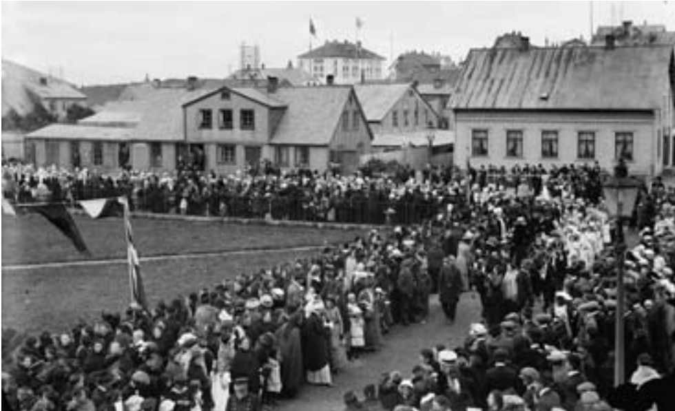
Konur fagna kosningarrétti á Austurvelli, fyrir framan Alþingisbúsið, 19. júní 1915. Ári síðar var kosið til Alþingis en kona náði ekki kjöri til þings fyrr en 1922.