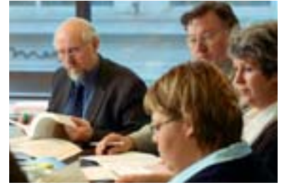
Í fjárlaganefnd sitja ellefu þingmenn en níu í öðrum fastanefndum.

Þingnefndirnar kjósa sér formann og varaformann. Þeir geta hvort heldur er verið úr röðum stjórnarliða eða stjórnarandstæðinga. Nefndirnar eiga fasta fundartíma á morgnana fjóra daga vikunnar á þingtímanum. Utanríkismálanefnd hefur nokkra sérstöðu þar eð hún er ríkisstjórninni til ráðuneytis um meiri háttar utanríkismál. Skal og bera undir nefndina slík mál, jafnt á þingtíma sem í þinghléum. Hver fastanefnd hefur starfsmann, nefndarritara, sem undirbýr fundi, ritar fundargerðir, aðstoðar við gerð nefndarálita og breytingartillagna og aflar upplýsinga og vinnur úr þeim.