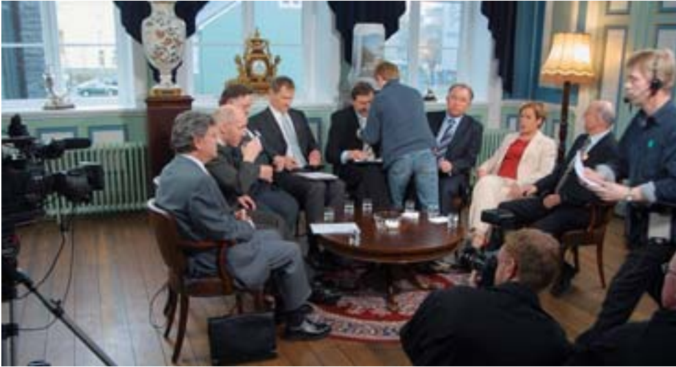
Umræður forustumanna flokkanna kvöldið fyrir kjördag í maí 2003 fóru fram í Alþingishúsinu og var sjónvarpað beint þaðan.