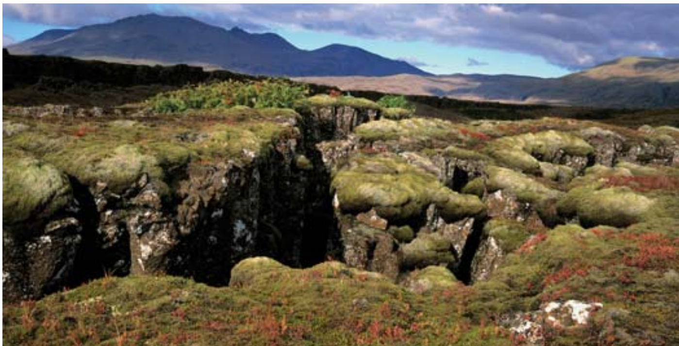
Saga og náttúra Íslands eru óvída jafnsamtvinnaðar og á Þingvöllum. Þar gefst einstök yfirsýn yfir jarðfræðisögu og lifandi náttúra Þingvallasveitar á sér vart blidstæðu. Á Þingvöllum var allsberjarríki á Íslandi komið á fót með stofnun Alþingis 930 og þar kom þingið saman allt til ársins 1798.

Ákvarðanir sem teknar eru á Alþingi hafa áhrif á daglegt líf allra Íslendinga. Markmiðið með útgáfu kynningarbæklinga um Alþingi er að greina frá skipulagi og störfum þingsins ásamt sögu þess. Bæklingurinn ætti að nýtast öllum þeim sem hafa áhuga á að fræðast um Alþingi og jafnvel til kennslu í framhaldsskólum.