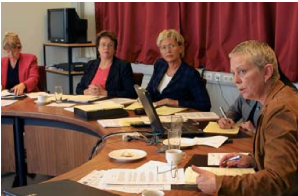
Frá fundi í heilbrigðis- og trygginganefnd. Nefndirnar eiga fasta fundartíma á morgnana fjóra daga vikunnar á þingtímanum.

Þú getur farið fram á að fá að koma til fundar við þingnefnd og ræða mál sem nefndin hefur til meðferðar. Sími: 563 0500.