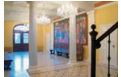
Með endurbótum í forsal á 1. hæð Alþingishússins sumarið 2003 var leitast við að hæðin yrði sem líkust því sem gert var ráð fyrir í teikningum af húsinu.