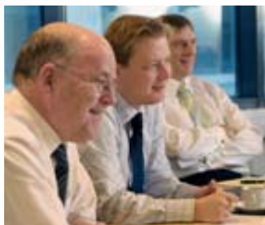
Frá fundi í iðnaðarnefnd.

Fastanefndir þingsins eru tólf: allsherjarnefnd, efnahags- og viðskiptanefnd, félagsmálanefnd, fjárlaganefnd, heilbrigðis- og trygginganefnd, iðnaðarnefnd, landbúnaðarnefnd, menntamálanefnd, samgöngunefnd, sjávarútvegsnefnd, umhverfisnefnd og utanríkismálanefnd, auk kjörbréfanefndar sem hefur einkum það verkefni að rannsaka kjörbréf nýrra þingmanna og varaþingmanna.