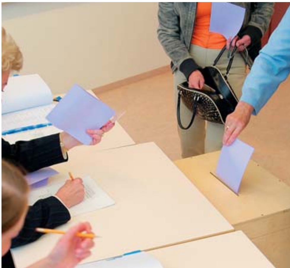
Við alþingiskosningar 10. maí 2003 voru um 211 þúsund kjósendur á kjörskrá og neyttu 87,7% þeirra kosningarréttar síns.

Með skrifum í fjölmiðla og með því að gefa fréttamönnum ábendingar.