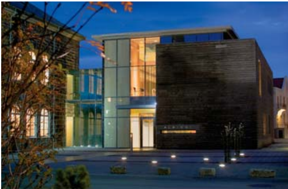
Skálinn, þjónustuviðbygging við Alþingishúsið, var tekinn í notkun haustið 2002.